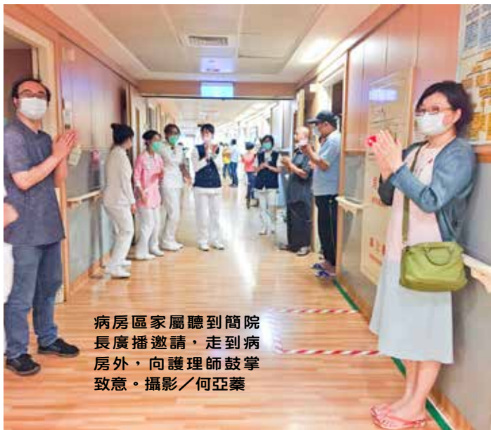
病房區家屬聽到簡院長廣播邀請，走到病房外，向護理師鼓掌致意。