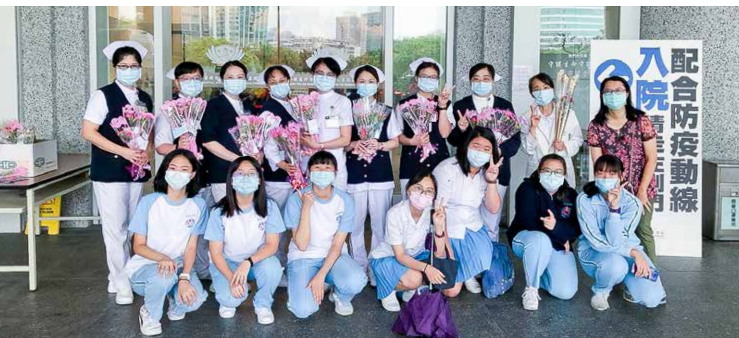
崇光女中學生將義賣所得的款項購買康乃馨，贈送予護理師表達感謝。