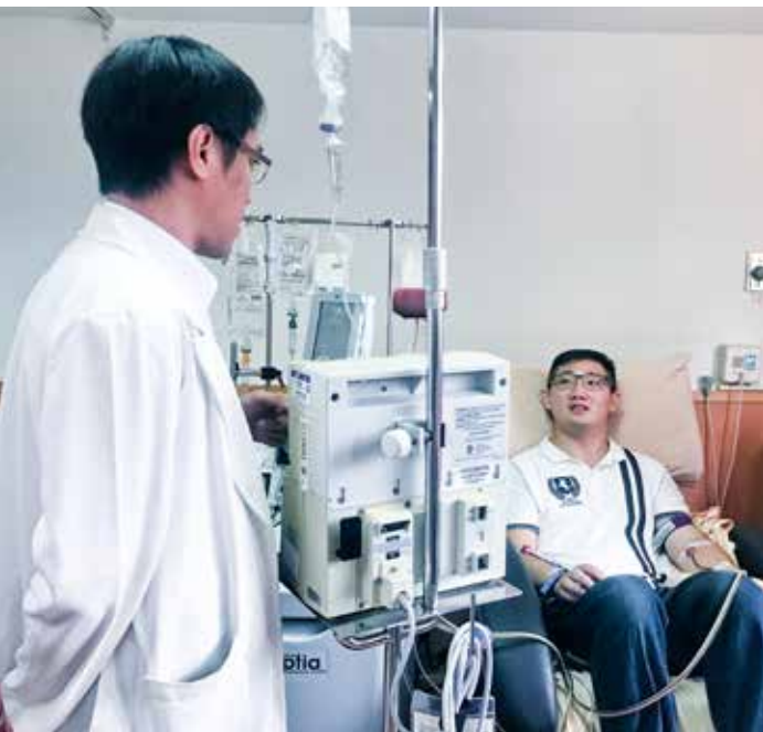
三十年前在花蓮慈濟醫院救回來的小生命健康長大，並回到自己獲救的醫院捐出造血幹細胞救人。

培訓志工後，書源開始茹素，茹素之後，他很意外地發現自己對很多事情的看法，開始有了不一樣的感受。「以前從來是有淚不輕彈，不知怎麼的，茹素後很會哭，也很愛哭。」也許是慈悲心起，開始覺有情，他不再做傷害生命的事，平時茹素護生護大地，積極地投入人文真善美志工與靜思鼓隊行列，現在還有機會捐髓救人，他更是義不容辭，認為是非做不可的事。