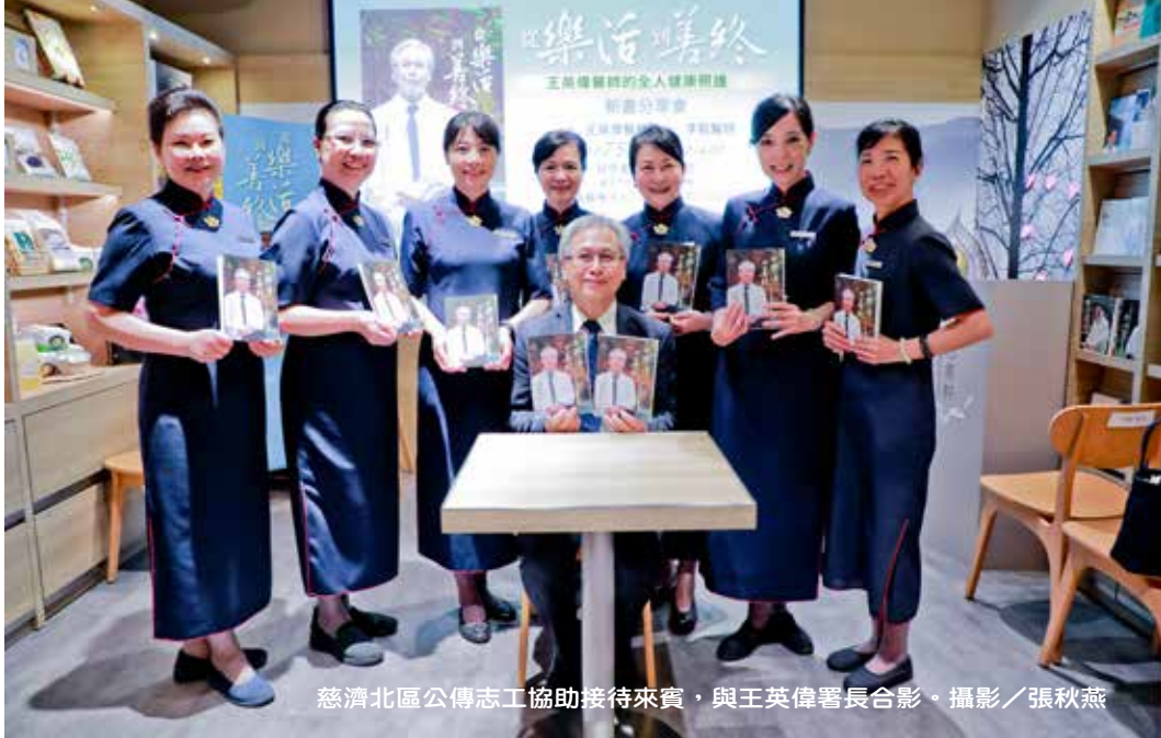
慈濟北區公傳志工協助接待來賓，與王英偉署長合影。

能與民間組織、衛生局、學校等單位合作，推廣全民健康識能的提升、活躍老化、預防疾病等政策，是自己最大的福報。新書書名《從樂活到善終》，正好把他這三十年來的實踐與精神，做了最佳詮釋。新書會最後在大排長龍的簽書、擁抱與合影留念中，圓滿結束。🌱