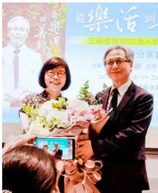
國民健康署副署長賈淑麗（左）感恩署長王英偉（右）帶給國健署許多新觀念與做法。

對於這場臺上的搶人大戰，王英偉倒是很從容淡定。自二〇一六年借調至國健署以來，王英偉除了積極推動國民健康識能、健康促進、活躍老化外，他認為公務體系的人才培育也非常重要，如