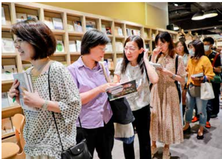
讀者大排長龍，等待簽書。

課程、反思課程，讓醫學系的學生從一到六年級，都能結合原有課程，將醫療人文帶入醫學教育，也帶領學生深入部落、社區訪查，再讓學生討論、深思、分享見聞，讓「醫學」變成一門有溫度的學科。