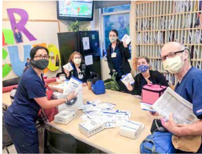
艾默瑞大學醫療中心加護病房部門再度收到防疫物資而士氣大振，回傳照片感謝慈濟的捐贈。

在捐贈的一路上，聽見許多醫護分享他們在第一線的情形，像是麻醉科醫師經常要為無法呼吸的染病者插管，在操作時會靠近患者的口鼻處，容易造成傳染上的高風險。麻醉醫師是眾多第一線醫護的縮影，更是顧人忘己、為病人拔苦的真英雄，在在讓志工心生敬佩與不捨，因此無論路程遠近，慈濟團隊秉持