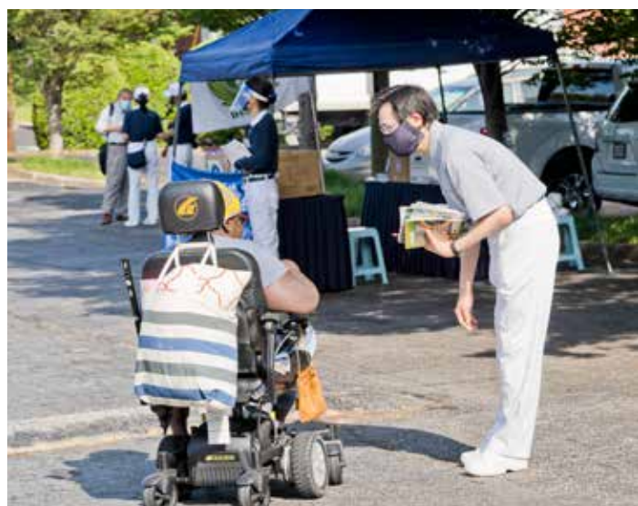
為守護社區健康，慈濟亞特蘭大分會於五月二十三日免費發送口罩，志工親切為民眾服務。

另外，為守護社區民眾健康，慈濟亞特蘭大分會於五月二十三日提供口罩得來速 (Drive-Through) 服務。當日一早領取口罩的車潮頓時湧現，甚至還有驅著電動輪椅的附近居民前來，多位志工一起送上口罩與慈濟刊物，一整天共送出了七千六百一十只口罩，嘉惠的民眾有華裔、亞裔、白人、非洲裔及西語裔等不同族裔。雖然戴著口罩，無法看清楚彼此的臉，但是經由合掌、鞠躬、或揮手致意的互動，都接受到雙方真誠的感恩與祝福。