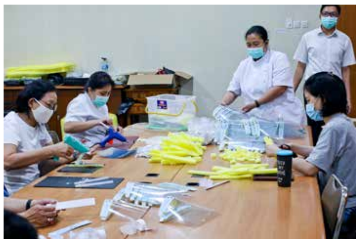
防疫期間，醫院同仁與志工合力為小病人裁製防護面罩。