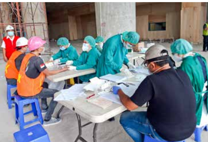
印尼慈濟大愛醫院醫護人員為興建印尼慈濟綜合醫院的建築工人進行新冠肺炎快速檢測，守護工人健康安全。