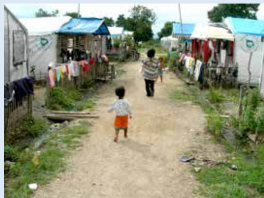
當地兒童赤足行走，看在醫師眼裡，心疼不已。

在萬人塚看到無情的天災，瞬息之間，讓數十萬人慘遭滅頂，讓幾百萬人家破人亡，也目睹陸上行舟壓垮村民的