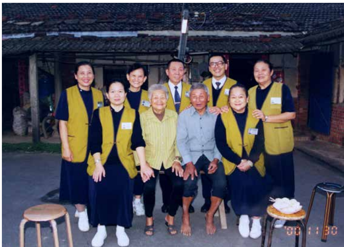
志工們接觸到這對淳樸的老夫妻，不僅讚嘆他們是世界上最富有的人。