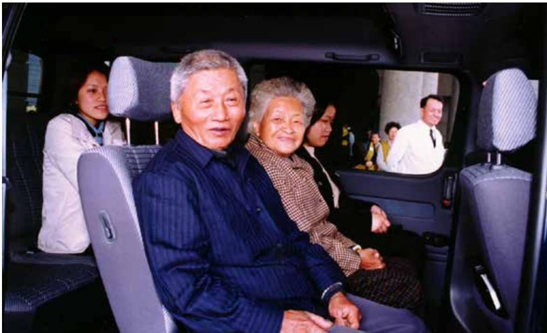
阿公阿嬤想捐車的善念如拋磚引玉般，讓大林慈院的交通車從一部變成兩部，更帶給員工不小的振奮和啓發。圖為他們坐在交通車上欣喜的樣子。

沒想到我在員工朝會中分享後，愛的迴響如雪花般不斷，最後連志工們也堅持要加入，後來從一部九人座車變成兩部，這是想不到的收穫。更重要的是，這事件當時帶給員工不小的振奮與啓發！更多員工因此對慈濟更進一步了