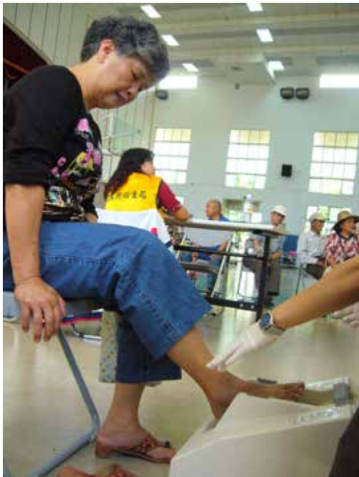
骨質密度檢測讓民眾印象深刻。

每年五月是關山地區整合式篩檢的月份，關山慈院是縱谷地區的唯一醫院，所以篩檢的支援服務工作便由醫院同仁承擔下來。