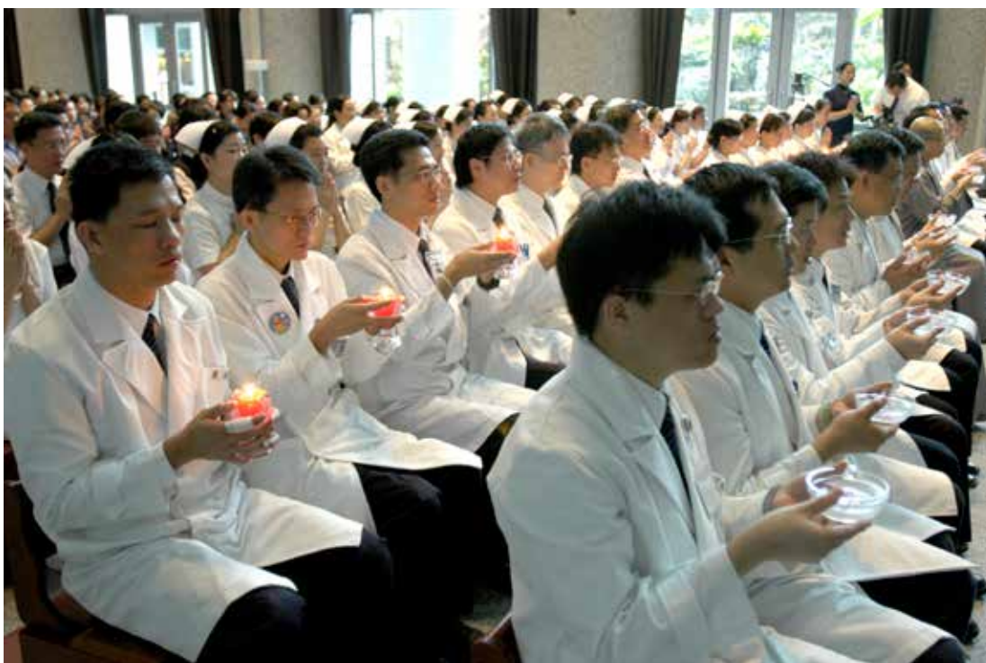
在醫護同仁虔誠祈禱下，台北慈院慶祝週年慶活動圓滿閉幕。

頂著烈日驕陽，醫護同仁們個個頭戴斗笠、埋首種菜，一眼望去，只見那菜園裡的農夫盡是穿著白袍的大醫王與白衣大士，平日拿著手術刀、聽診器與針筒的救人雙手，這時一個個拿起了鋤頭與鏟子，形成了一幅既奇特又感人的畫面。醫護同仁們雙腳踩在泥地裡、雙手撥弄著泥土，小心翼翼的把菜苗一一栽