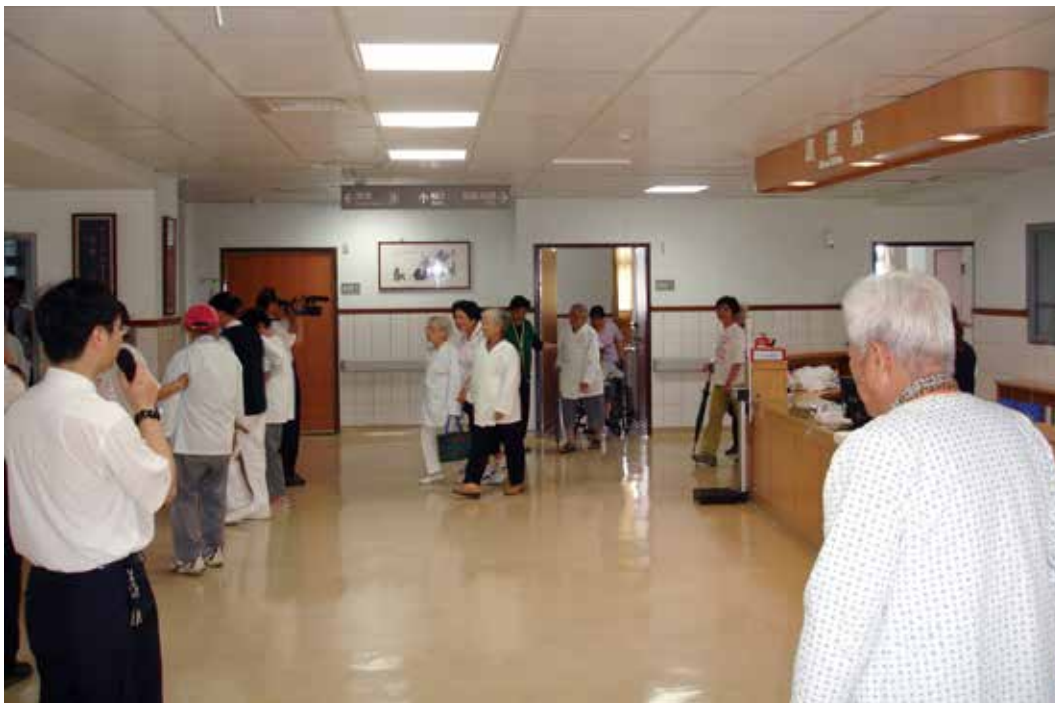
模擬病患的長輩們在聽到疏散的口令後，依序互相扶持離開現場。