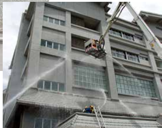
下圖：消防局模擬救災情境，包含雲梯車共出動五條水線。

行消防演習，並分為室內初期滅火、避難引導等自衛編組演習，以及以消防隊支援為主的戶外救災等兩個階段，同時消防隊也因應玉里慈院高樓層的地理因素，加派雲梯車進行高空救援作業與高空射水壓制火勢。