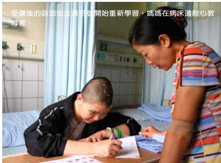
受傷後的詠茹從注音符號開始重新學習，媽媽在病床邊耐心教導著。