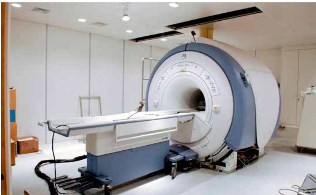
影像醫學部的高科技儀器，讓台中慈院的神經醫學團隊在一啓業時就具備醫學中心等級的醫療水準。