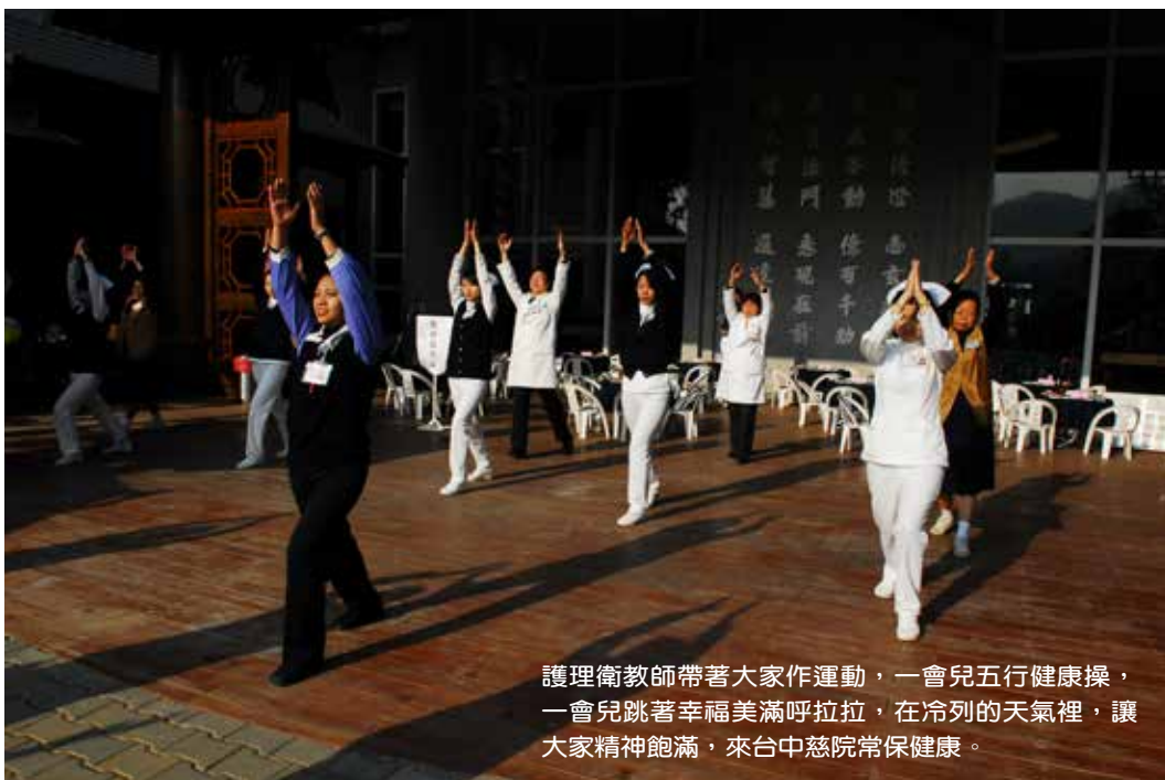
護理衛教師帶著大家作運動，一會兒五行健康操，一會兒跳著幸福美滿呼啦啦，在冷冽的天氣裡，讓大家精神飽滿，來台中慈院常保健康。

早晨九點，來過五關（填表、身高體重檢測、脂肪檢測、骨質密度檢測、血壓血糖檢測）的鄉親，已坐滿了填表區，過五關者可領到只送不賣的結緣品——由台中慈院醫療團隊合著的新書《守護健康，預知疾病123》，更有各科室，醫師、主任、以及營養師為你解答，健康有關問題。