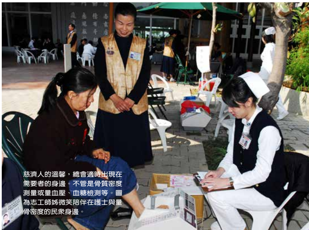
慈濟人的溫馨，總會適時出現在需要者的身邊。不管是骨質密度測量或量血壓、血糖檢測等。圖為志工師姊微笑陪伴在護士與量骨密度的民衆身邊。

束時分享：「整天下來，天好冷、腰好酸，但卻覺得很有意義，因為透過基本的檢測，也可發現一些異常，早發現、早治療。」