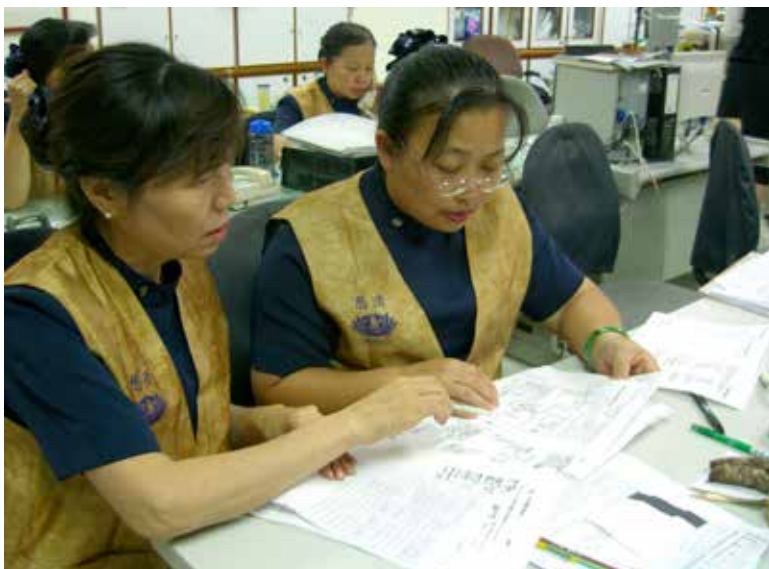
志工們正在進行相關檢驗報告的篩檢。