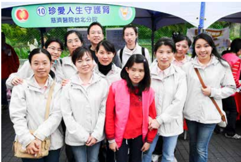
■ 台北慈院腎臟科專業愛心團隊於攤位前合影。

流程是藉由衛教室準備的文宣資料，讓闖關者先行索閱，就其內容「你了解自己的腎臟？」、「藥物與腎臟有什麼關係」、「如何保護腎臟」、「慢性腎