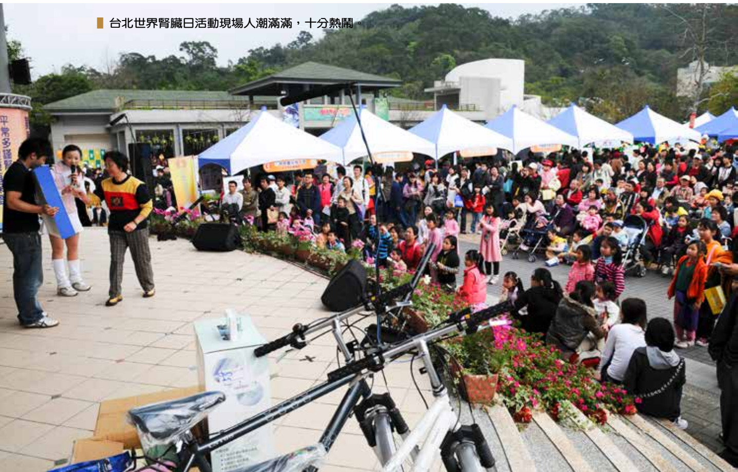
■ 台北世界腎臟日活動現場人潮滿滿，十分熱鬧。

鑒於目前國人每六百人就有一人接受洗腎透析，末期腎臟病的成長率更是高居全球之冠。台灣腎臟醫學會和行政院衛生署國民健康局合作，於二〇〇四年開始成立慢性腎臟病防治機構，在地方衛生局協助下，展開全面國民腎臟教育