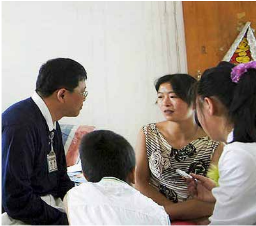
■ 傾聽許多村民說著頓失所愛的故事，給予安慰與關懷。

相互關懷。慈濟志工用心去擁抱災民，給予愛的膚慰；希望這分不斷接力傳承的愛，能持續陪伴災民，慢慢修復他們的創傷，讓他們再生出力量