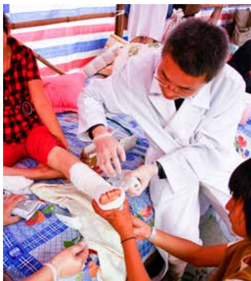
文/葉添浩 高雄慈濟人醫會醫師

「慈濟新聞深度報導」獲知最新災難訊息，總是迫不急待希望能盡己微薄之力幫他們，心中嘀咕著：「不曉得能否在緬甸及四川辦義診？」但也只能虔誠齋戒祈禱，並祝福遠方的災難能化險為夷，人心淨化，社會祥和，天下無災無難。聽著上人哽咽臨泣的開示，內心由衷淌血悲悽，想著師父「無緣大慈，同體大悲」的身教，身為弟子應該跟著師父的腳步，分憂解勞。師父內心的痛是多麼貼近災民的痛，悲災民心中的悲，苦災民家園破碎、親人離異的苦，師父的內心是這麼的慈悲。想著想著，內心沉浸在那種深刻的感動，提醒著我隨時準備要出發，雖無法像史懷哲一樣的深情大愛，長期投入非洲等落後地區行醫，但我的心是跟他看齊的，只要有機會去災區付出，我就要把握。