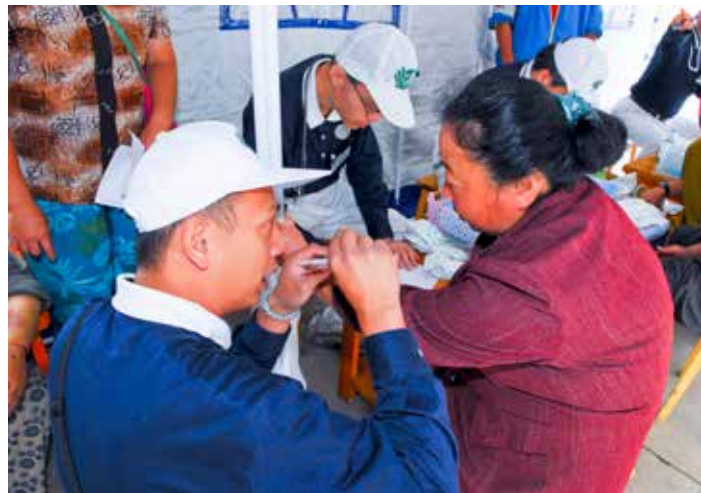
■ 有了醫療站，接下來藥品的準備就是最重要的工作。圖為護理師不僅幫病人處理傷口，也補位包藥給藥。