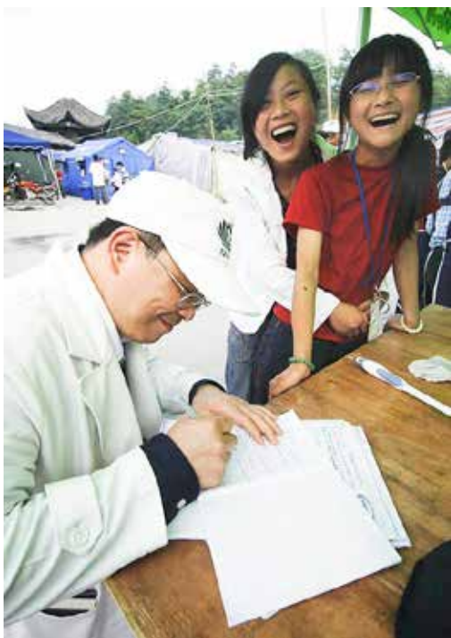
■ 慈濟志工的溫暖讓孩子們樂得每天前來幫忙。

心和方向，也能找到存在的價值；但當一段時間後，更複雜現實的問題還是會逐漸浮現，如上班和上學不順，家中原有的東西沒了，甚至家人關係發生大變化等，這都要一一去克服，也需更長的時間去調適，可能兩、三個月、六個月，甚至一、兩年都有可能。內心的創傷，不像身體的傷口好得快；災民的心理症狀，可能在一段時間後才會陸續出現。