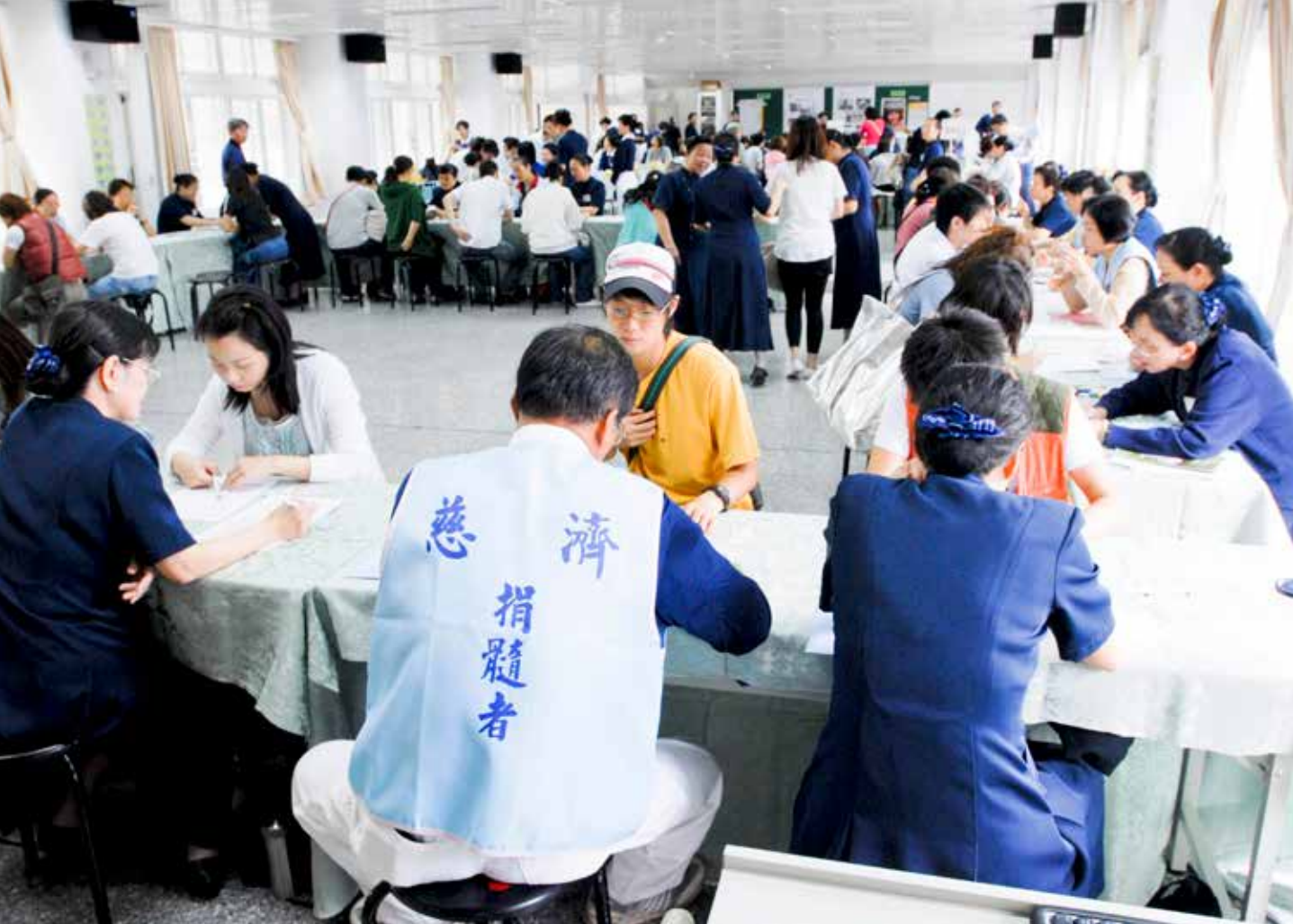
■ 在天母舉辦的骨髓捐贈驗血活動，邀請捐髓者現身說法。