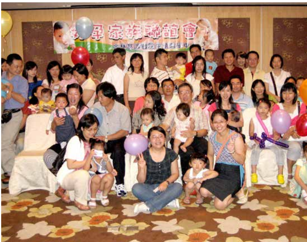
■ 大林慈院生殖醫學中心好孕家族活動參與人員歡喜合影。