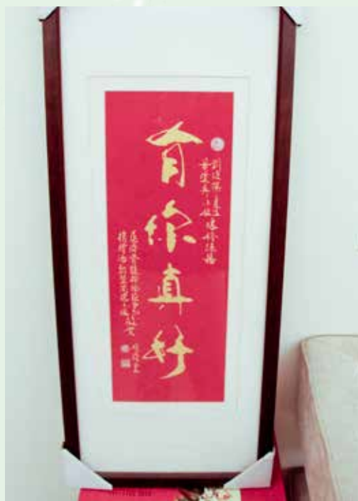
俊傑與瓊英結婚時，慈濟骨髓幹細胞中心特地送上「有你真好」的匾額，感謝這對有愛心的捐髓夫妻。

通常骨髓捐贈最大的阻力都是家人，而眼前的這兩位年輕人有著相同的智慧，在「可以救人、又無損己身」的理念下，勇敢的付出，把握救人的因緣，並改變了家人的想法。二〇〇五年結婚後，他們幸福的生活令人羨慕，相信他們捐髓的歷程和經驗更懂得體貼惜福。現在這對年輕夫妻在社會上貢獻專長，看著他們的婚姻生活幸福美滿，就是關懷小組最大的欣慰。