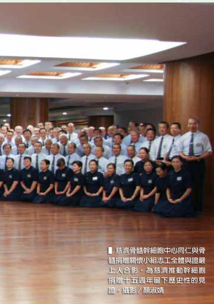
■ 慈濟骨髓幹細胞中心同仁與骨髓捐贈關懷小組志工全體與證嚴上人合影，為慈濟推動幹細胞捐贈十五週年留下歷史性的見證。

慈濟骨髓捐贈資料中心並在二〇〇二年開始增加收集臍帶血，正式改制為「慈濟骨髓幹細胞中心」。依據統計，至二〇〇八年十月，慈濟骨髓幹細胞中心已經累積了三十一萬七千七百二十筆的資料，雖然不若對岸快速成長的中華骨髓資料庫共九十萬筆來得龐大，但慈濟骨髓幹細胞中心十五年來秉持慈悲入骨，髓愛國際的精神，供髓廿七個國家，成功移植一千七百一十五例的成績，已經成為全球華人骨髓資料庫中骨髓輸出量最多以及移植成功率最高的資料庫，也造就台灣成為實至名歸的愛心之島。