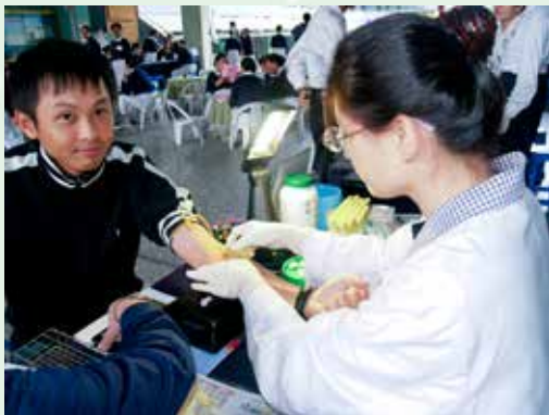
■ 在申請國際認證的同時，社區角落的骨髓捐贈驗血活動照常進行。