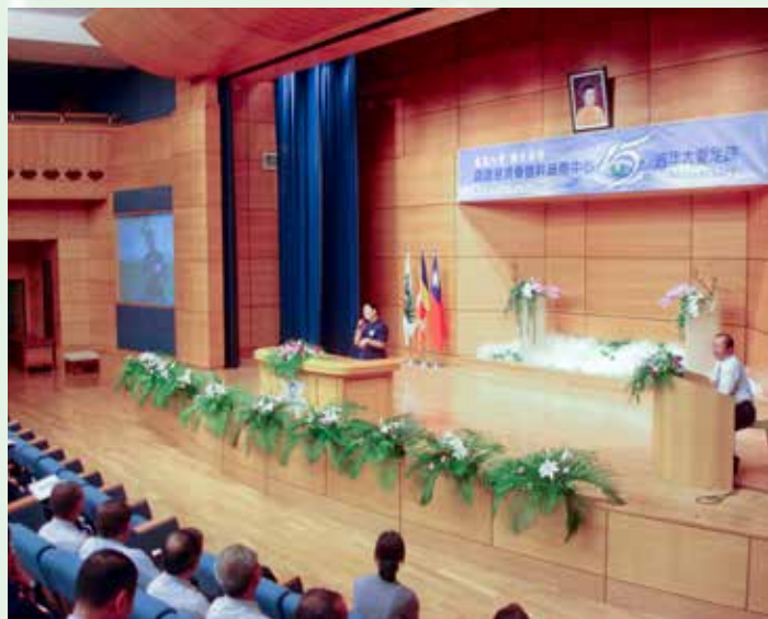
■ 志工們談起勸捐骨髓過程的感受，總是笑中帶淚，感動不已。右為慈濟骨髓捐贈關懷組總幹事陳乃裕師兄。

慈濟骨髓幹細胞中心經過十五年的步步耕耘，不但成功啓發無數善念，一路上將愛傳遞到世界各個角落，拯救生命，重新燃起一千七百多個家庭的希望。愛像一首歌，唱盡世界的感動；即將在明年向「世界骨髓捐贈者協會」提出認證申請的慈濟骨髓幹細胞中心，必須完成共三百六十九項的要求才合格，雖然志工所扮演的招募者只佔其中三項，然而一心為善，付出無所求的關懷小組志工，用一顆單純的心，讓天涯海角的兩個生命在第六對相遇，這樣的無私無染、無價的善行，正是慈濟骨髓資料庫在全球骨髓資料庫中，最動人、最美的風範。