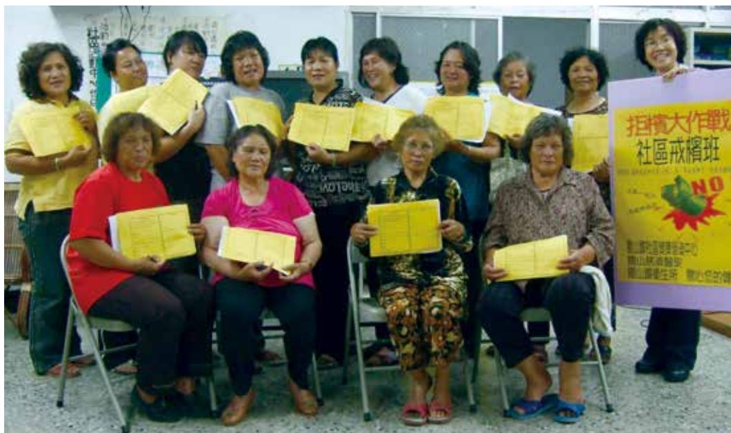
■ 關山的原住民婆婆媽媽們每個人都簽下切結書並拍照存證，等待八週後驗收成果。

嚼食檳榔對家庭、社會造成負面影響，不幸罹癌後所造成之醫療使用及家庭負擔，亦都是一項沉重的負擔。為期能為促進民眾健康，關山慈院歷年向國民健康局申請健康營造中心計畫，成立健康營造中心推動社區健康促進工作，