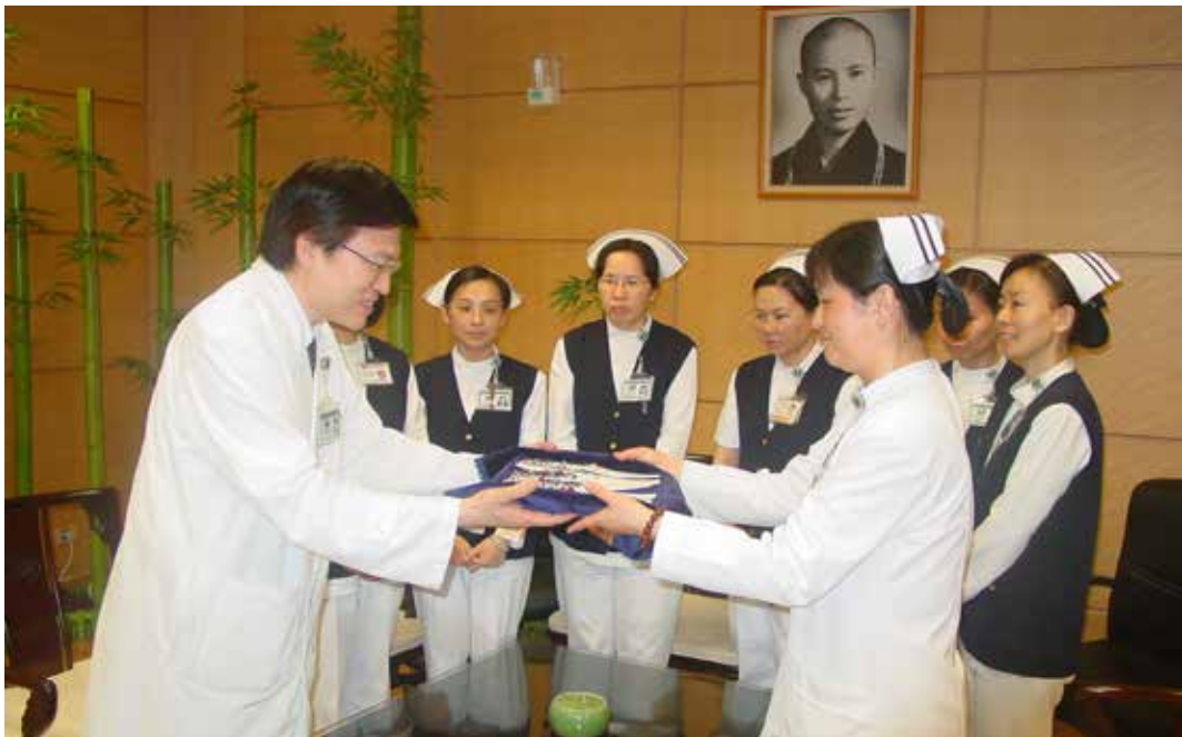
■ 臺北慈院院長親自致贈護士節禮品，感恩勞苦功高的白衣大士，守在第一線守護生命。

這是趙院長第二次透過廣播系統，對全院同仁及到院病患大德及家屬公開談話。上一次，是川震發生過後，為呼籲大家響應賑災行動，趙院長首次透過廣播，表達對川震受災民眾的關心與疼惜。今天，川震正好滿周年，而也正逢護士節，趙院長的聲音再次出現在廣