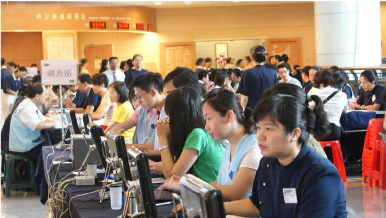
■ 骨髓捐贈驗血活動讓臺北新店區的志工動員起來，整個臺北慈濟醫院陽光大廳充滿發心捐血配對的人。

這個週末的震撼教育，給了我很大的啓示，面臨死亡即將到來的憂慮，或是擁抱生命契機的喜悅，並非吾等能準確預測或掌控的，重要的是如何提升「兩難抉擇」應變措施的處置與情境壓力下的紓解。感受生命無常的同時，宜「廣結善緣」「把握當下」，修福報，增助緣！