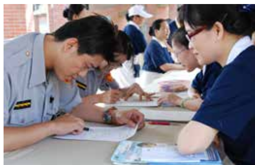
■ 新竹縣警察也發心響應慈濟的骨髓捐贈驗血活動，於解說填表區進行捐贈表單填寫。

今天不過去了！很對不起，經過了一夜長考，基於妻子的身體狀況無法承受，而且家人給予的強大壓力，我們決定不捐了！」之後，我們在空中文交談互動了半個多小時，這中間心情起伏震盪，時而平靜，時而大風大浪，聽似有望，卻又絕望現前！我拿著手機走進走出，忽站忽坐忽跪，淚水不時奪眶而出，這半