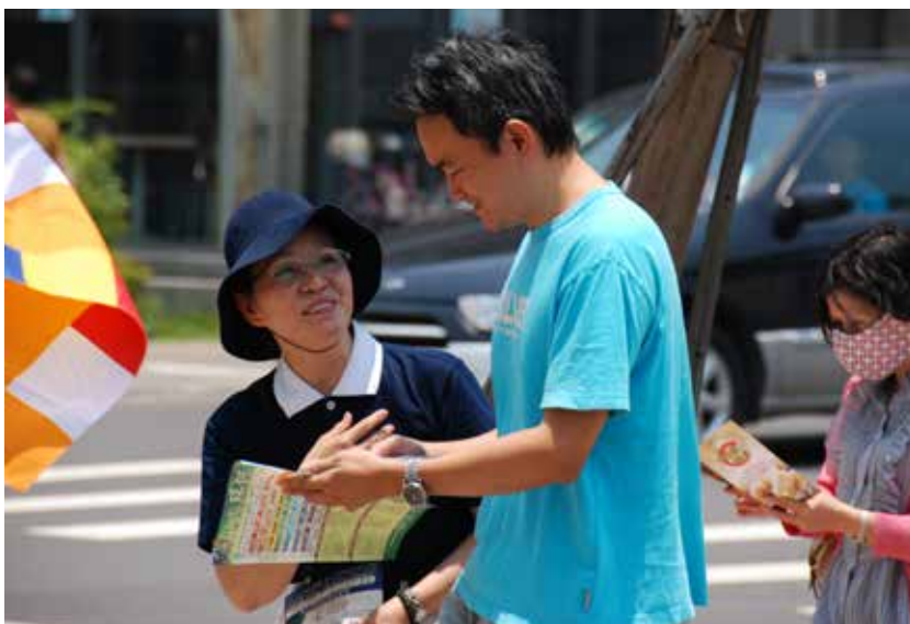
■ 慈濟志工頂著烈日對著路過的民眾說明活動的目的，以及邀請他們一同響應骨髓捐贈。

身容易緊張，經多次量血壓均高於標準許多，她並不知有高血壓而未治療，近日氣候悶濕熱，她睡眠品質差，且又因生理期來臨，導致體能下降，內分泌失調，免疫力差，再加上施打了三劑生長激素所產生的身體壓力及骨骼酸痛、頭痛，統合了以上多種狀況與累積的壓力，已超過她身心的負荷。因此引發了她在那個週六下午的暈眩症，天旋地轉而暈倒在地，嚇壞了現場所有的人，尤其是她的丈夫及媽媽。