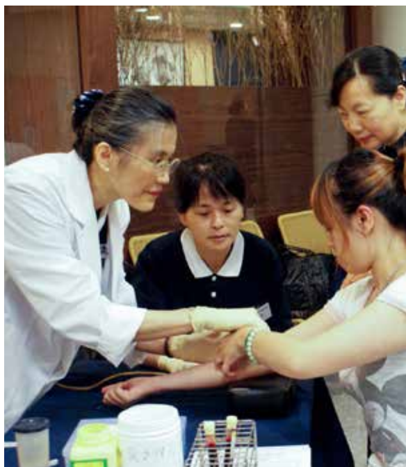
醫師站起來細心的為捐贈者抽血，慈濟志工也一對一的陪伴關懷，減輕捐贈者對抽血的害怕與恐懼。

那天晚飯時間，幫葉醫師聯絡電話，聽著電話的內容，突然，覺得胃口都沒有了！草草的結束晚餐，回到家中，臥室窗外的風，很大，蓮花颱風，名字雖美，發起威來可一點都不溫柔，尤其在十樓的高度，吹的人心裡直打顫！