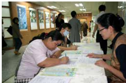
■ 預立意願書可以讓自己自主生命最終的照護方式，世界安寧日當天，許多民眾響應簽署「安寧緩和醫療意願註記健保IC卡登錄」。

活著，是最好的禮物；善終，是最美的祝福。面臨死亡大都同樣焦慮恐懼、手足無措，但選擇適當的臨終照顧，便能把握住每一刻，畫下圓滿無憾的句點，而不會到最後才恍然發現，什麼都來不及交代準備，生死兩相憾。選擇安寧療護、活得有品質，且臨終前不遭受痛苦的急救，才是生死皆無憾，人生最後的幸福！