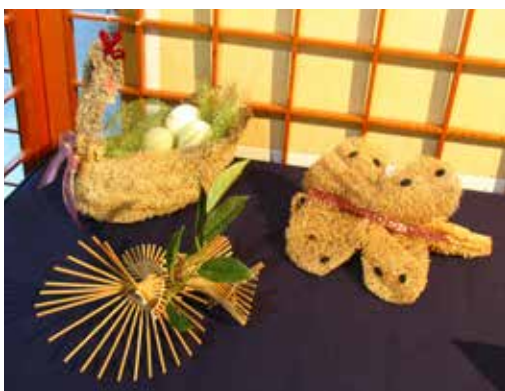
■ 大林慈院心蓮病房病人家屬作品。當病人往生之後，家屬藉由不同形式的創作懷念逝去的親人，也能獲得心靈的撫慰。

花蓮慈濟醫院門診長廊開辦的「傾聽心蓮綻放」海報展，藉由文字與生動的相片，展現病人的創作與故事；有父親對小孩的不放心、有孩子一生中為父親做的各項第一次、有病人在住院期間感受到從未有過的愛，穿插著病友間的鼓勵、志工無私的關懷、宗教師、護理師、醫師的陪伴等等，讓一般大眾更能了解安寧療護，也讓醫護人員學習到生命的議題與照顧的精神。