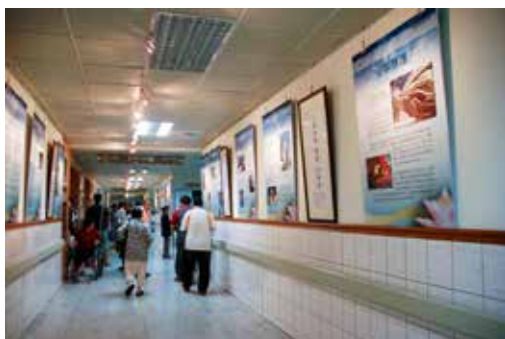
■ 花蓮慈院在人來人往的門診大廳舉辦「用心傾聽朵朵心蓮綻放」海報展，藉由每一個讓生命發光的故事，引導民眾了解安寧療護的意義。

一九一八年生於英國的桑德絲（Dame Cicely Saunders），在二十三歲成為護士，她雖熱愛照顧病人，卻因為背痛而無法勝任護士工作，便積極修取社工學分而在三十歲那年成為社工人員。她照顧一位年輕的癌症病人大衛，兩人建立起深厚的友誼。但是當時醫生對癌症病人的疼痛仍是束手無策，桑德絲看見大衛的痛苦，決定為癌症病人在醫院裡建立一個像家的地方。