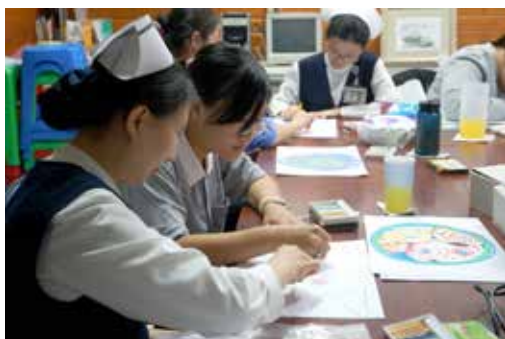
■ 花蓮慈院心蓮病房的護理人員與志工也會定期進行藝術治療的課程，藉由繪畫紓解情緒，也進一步更了解病人的心情。

藝術治療就是在痛苦中的一種體會抒發與轉化悲傷的道別。十月十五日大林慈濟醫院與財團法人中華民國（台灣）安寧照顧基金會與共同舉辦一系列