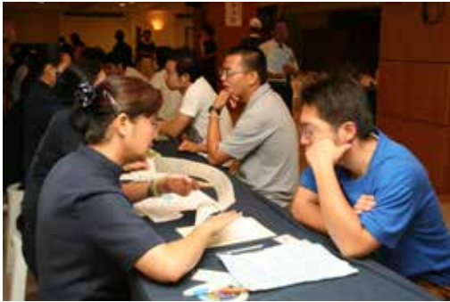
■ 年輕人見證慈濟在驚世風災最困難時刻及時付出，溫暖同胞，因此信任慈濟，也想盡一份心力，幫助生病的人。