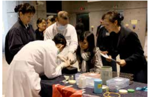
■ 在臺北科技大學舉辦的骨髓捐贈驗血活動，慈濟人醫會醫護人員細心地為捐贈者抽血。

再次住院是二月初，轉入無菌室後開始注入化學藥劑，沒想到第三天早上護士發現我身上長出疱疹，立刻通知醫師。移植日期必須再次後延，要先治療