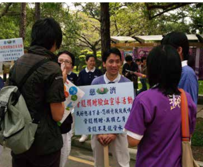
■ 新竹骨髓捐贈捐髓驗血活動宣導，慈青向往來學生宣導驗血活動。

接下三天我依然躺也不是坐也不是，在無菌室中睡眠品質、吃東西及擦澡是最困擾我的三件事。隨著日子過去，黴菌感染連續發燒、口腔黏膜破壞、喉嚨疱疹疼痛及舌頭的破損，讓我的痛苦指數與日遽增，需借助抗生素及嗎啡才能減緩疼痛感。在無菌室的生活就像是苦行僧的修行，連口水都覺得是苦的。內心再次大聲嘶喊：「我是最強的無敵勇者，世間沒有任何事可以輕易擊倒我。」這樣的堅定信念，總能讓身處黑暗深淵中的我，再度奮力找到一絲光明契機。