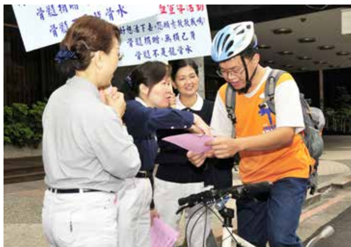
■ 每一個人、每十西西的血液都是希望，也因此慈濟志工不厭其煩的走上街頭，向來往民衆說明驗血活動的意義。