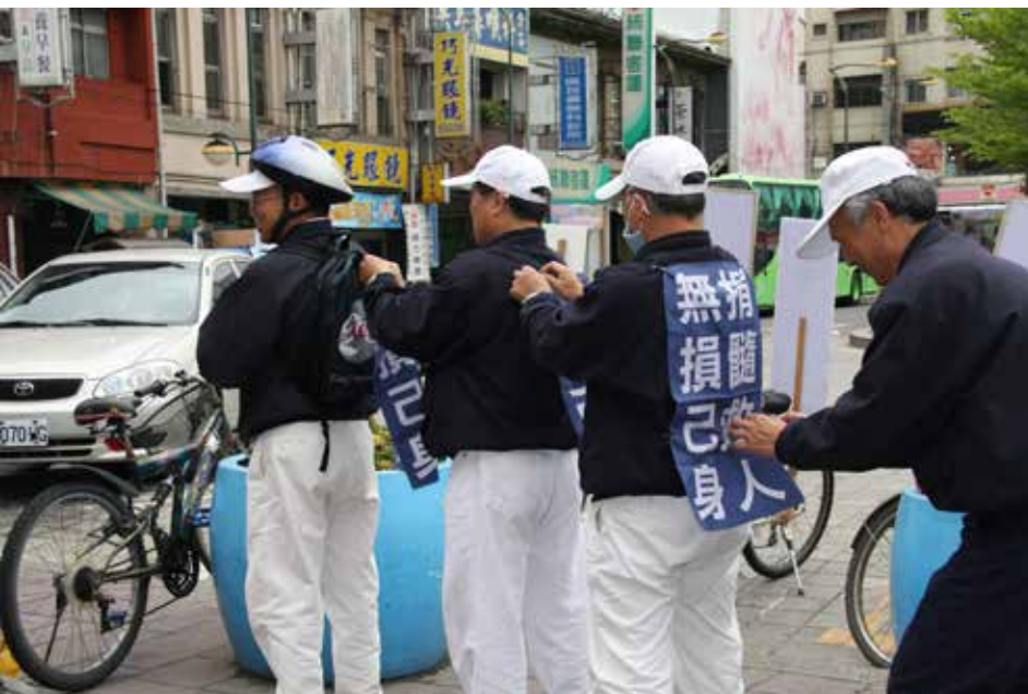
■ 彰化員林聯絡處舉辦「骨髓捐贈骨髓驗血活動」，骨髓捐贈關懷小組別出心裁想到將標語固定在身後的妙點子，騎腳踏車時就能變成行動看板，廣告周知。