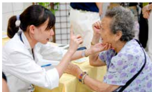
■ 醫師仔細的幫阿嬤檢查神經功能。