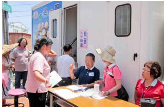
■ 豔陽高照的好天氣，讓民衆樂意參加臺中慈院和衛生局舉辦的整合性篩檢。

跟往年不同的是，過去臺中慈院是配合臺中縣衛生局提供人力支援，但是今年獨力統籌人力、物力，承接下臺中縣大里市、潭子鄉、后里鄉總計六場大規