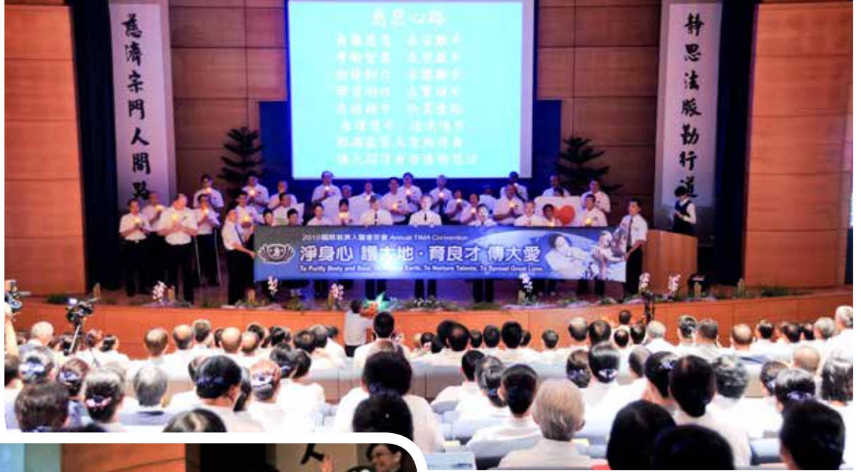
在眾人燭光中，二〇一〇年國際慈濟人醫會在颱風天中開幕。