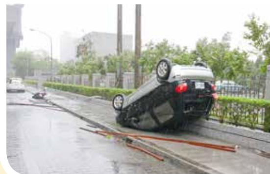
凡那比颱風直撲臺灣東部，強勁的瞬間陣風將小汽車刮起四輪朝天，大自然的力量深深影響人類的生活。