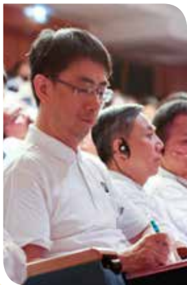
來自各地的人醫會學員把握進修充電的機會，仔細聆聽、紀錄邱教授的演講。

在針對四十種基因的研究，發現有些華人基因可能較易發生某些淋巴系統疾病。後來從美國一項一九七五到二〇〇六年的新發淋巴瘤研究發現，前十年淋巴瘤發生得很快，但後十年的發生率明