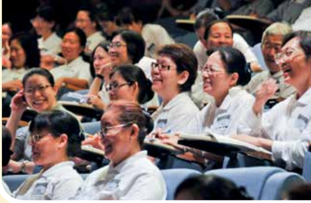
講師生動幽默的講課方式讓學員學員發出會心一笑。