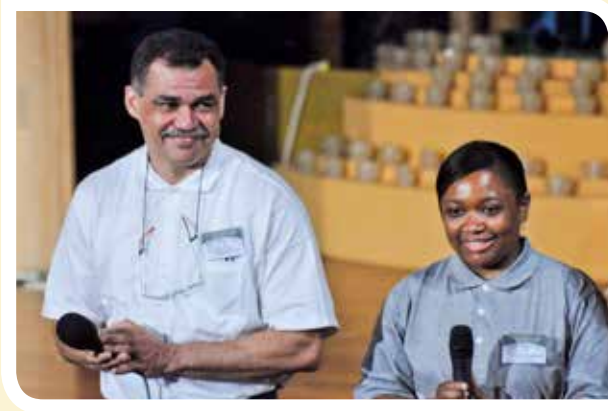
海地的沙納維醫師（左）第一次參加人醫會，看到世界這麼多醫師以愛心做治療，學到慈悲、大愛與奉獻，並發願要在海地落實做慈濟。

說：「萬般帶不去，唯有業隨身。」人生短暫，因此要時時把握當下，一切以善為出發點，做就對了，回國後，她要把這些種子發散出去，創造更多善的力量。