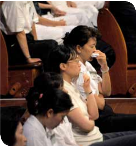
大體老師偉大的精神與事蹟，讓觀賞節目的人醫會學員忍不住感動鼻酸。