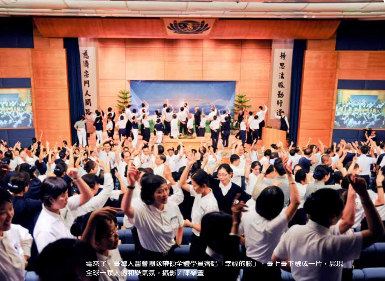
電來了，臺灣人醫會團隊帶領全體學員齊唱「幸福的臉」，臺上臺下融成一片，展現全球一家人的和樂氣氛。

員方便如廁。機動團隊搬來大型電風扇，讓微微涼風可以稍微紓解室內的溫度。寮房組也趁著學員就寢後或上課中，再度趕緊打掃整理，只希望讓學員有回到家的感覺。