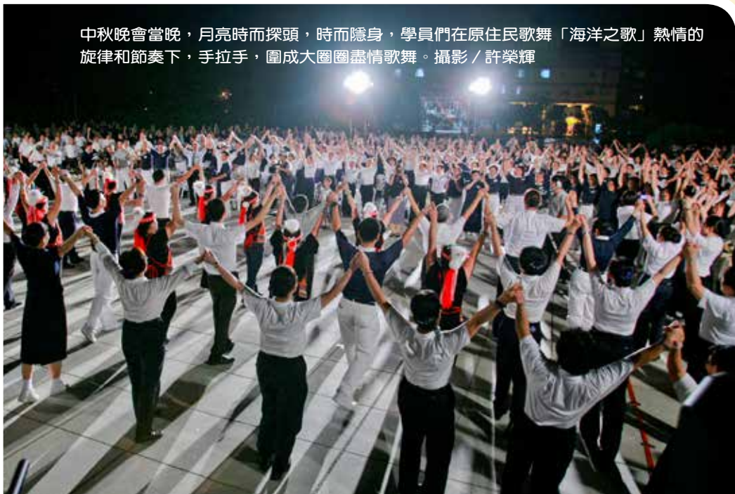
中秋晚會當晚，月亮時而探頭，時而隱身，學員們在原住民歌舞「海洋之歌」熱情的旋律和節奏下，手拉手，圍成大圈圈盡情歌舞。

他更期許醫療志工秉持慈濟人文，以病人為中心，「感恩、尊重、愛」為內涵，醫護發揮知識良能，解除病苦，更致力協助醫療資源貧乏地區的患者，盡情發揮人醫之愛，永不止息。