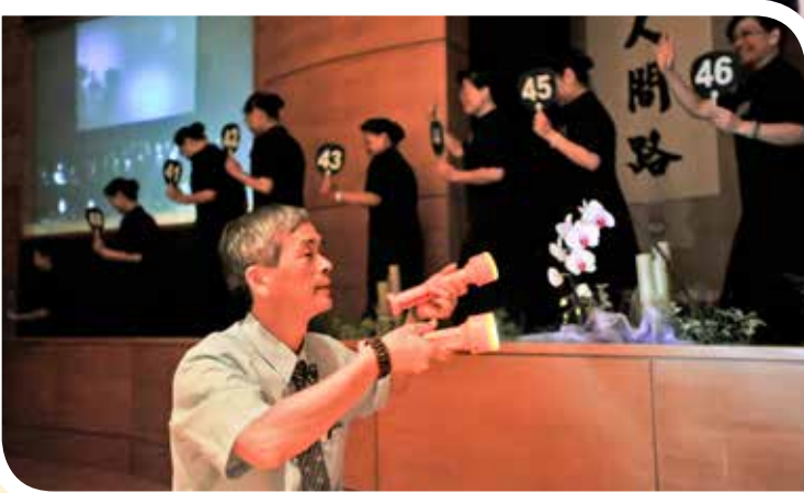
負責機動組的志工以手電筒照向大講臺，讓學員在停電中仍能看得清。

人醫年會正式展開。但是舞臺燈光系統因耗能較大無法使用備援電力，舞臺上的開幕儀式，勢必黑暗一片！總務機動志工拿起 LED 手電筒蹲在舞臺下充當人力聚光燈照向舞臺，讓大家可以看見舞臺上所呈現的效果，雖然燈光微弱，卻也讓開幕的現場氣氛更加凝聚，「淨身心、護大地、育良才、傳大愛」的布幕在舞臺上逐漸升起，在颱風之下人醫齊聚、互相傳承，在颱風之下如期舉行的年會，就如眾人齊唱的「慈悲心路」——在變數中考驗智慧、在艱難中激發韌力……更加彰顯二〇一〇年國際慈濟人醫會年會的主題。