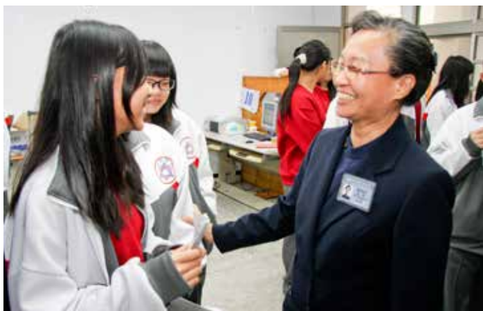
■ 志工們貼心的問候與關懷，讓女同學原本緊張的情緒獲得舒緩。