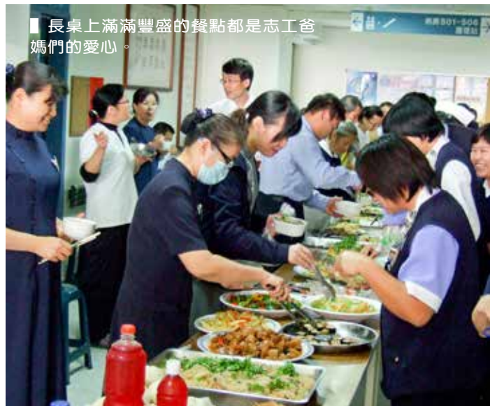
■ 長桌上滿滿豐盛的餐點都是志工爸媽們的愛心。

關山慈濟醫院與臺東區及關山區的志工們，每兩個月都會舉行一次院內同仁與志工的「家庭日」，讓慈濟大家庭的成員彼此