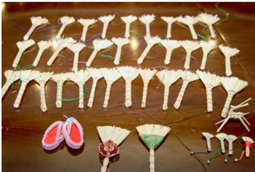
■ 完成的小掃帚可愛討喜又好用。