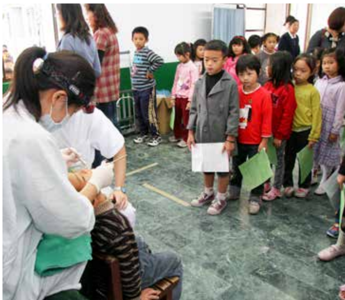
■ 來自偏遠地區的學童們齊聚在中城國小教室內，守秩序的排隊等候口腔檢查。