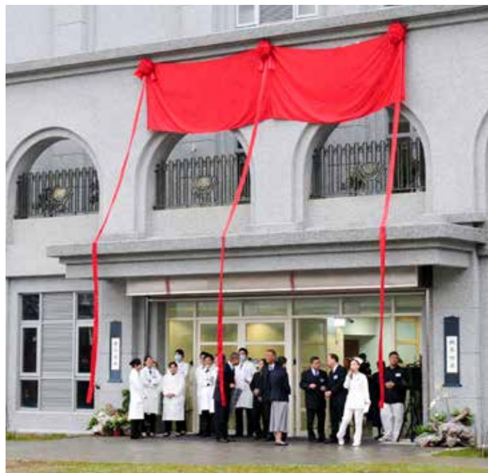
■ 臺北慈院身心醫學大樓啓用，提供精神病患一個安全與溫馨的療養空間。

未來，臺北慈院精神科醫療團隊將再擴展臨床服務，提升急性病房及日間照護，與社區結合建立完整的精神醫療照護網，成立自殺防治中心、酒藥癮防治中心、憂鬱及慢性疾病聯合照護網；此外，努力提升教學能力，取得精神科教學訓練醫院資格，結合臨床實務及神經精神科學研究擴展視野與世界接軌，建立與國內及國際學術機構合作聯盟，守護生命、守護健康、守護愛。（文／陳世財）