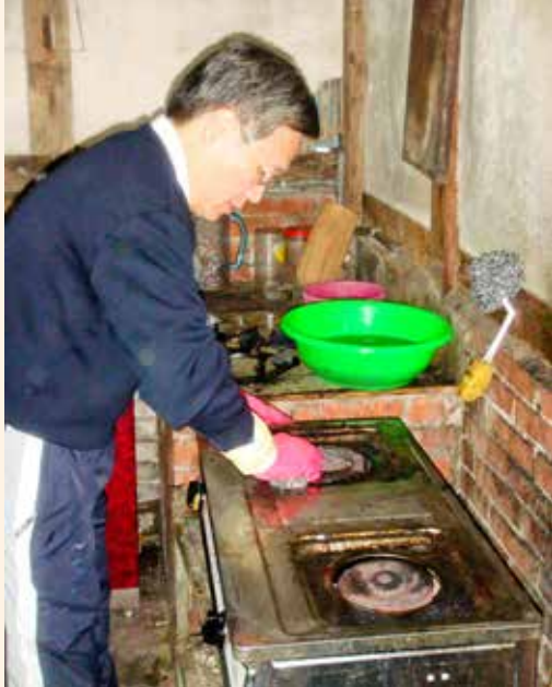
簡院長選擇了污垢最厚的廚房，拿著鋼絲絨取代清潔劑顧環保，賣力的刷洗。