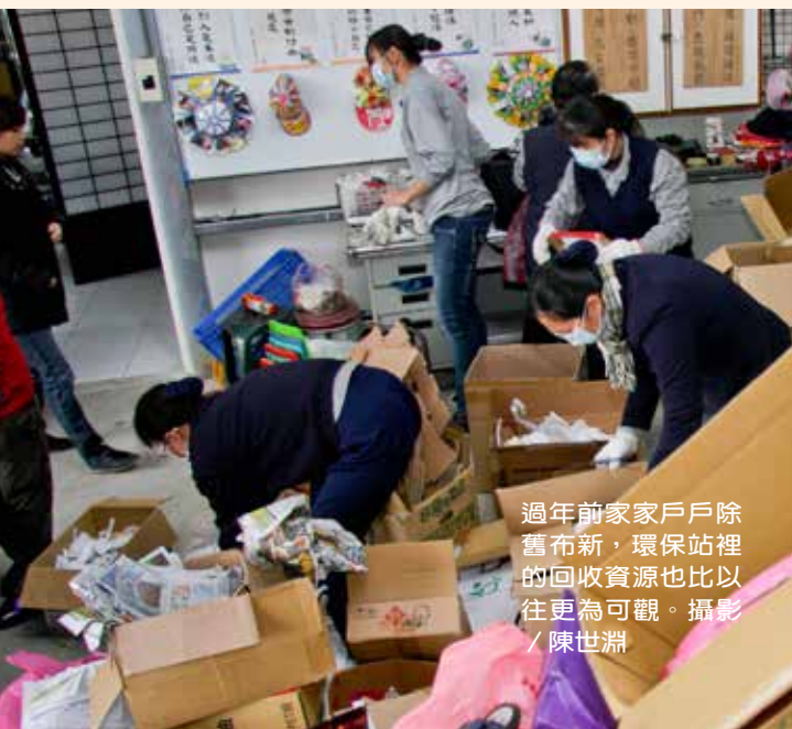
過年前家家戶戶除舊布新，環保站裡的回收資源也比以往更為可觀。

看著同仁們發揮現代愚公的本事，張院長說，「透過親身體驗，讓我們真正看到每天製造了多少的垃圾，所以大家要時時提醒自己別忘記『清淨在源頭』，將可利用的資源清洗乾淨再回收。」加入資源回收的行列，力行愛物惜福，也讓自己的心靈更清淨。