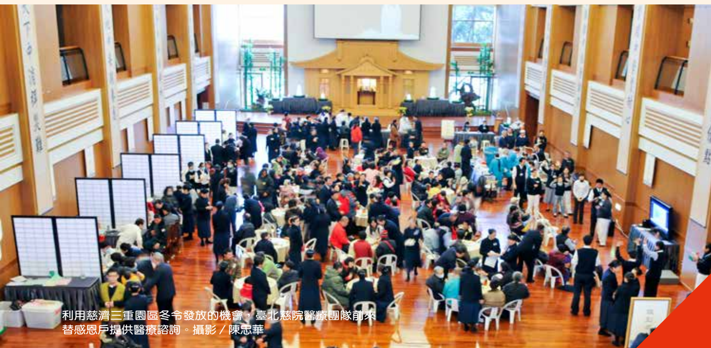
利用慈濟三重園區冬令發放的機會，臺北慈院醫療團隊前來替感恩戶提供醫療諮詢。