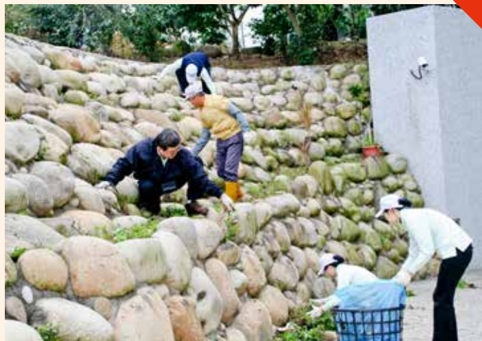
醫護人員爬上石頭鋪成的的斜坡，連石頭夾縫間的野草也都一一拔除乾淨。

今年院慶、藥師節、醫檢師節和歲末祝福結合從環保出發，同仁走出醫院走入社區，照顧環保志工的身體也促進自己的健康，身心靈都除舊布新。