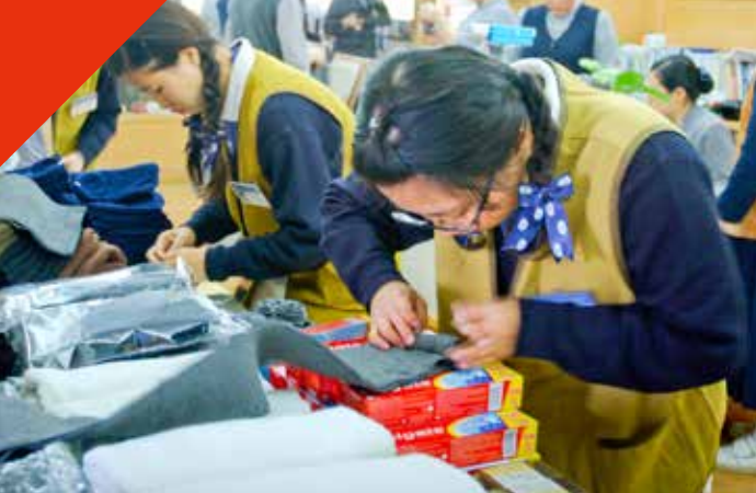
醫護同仁與志工們分工合作，仔細的將各式物資裝袋打包。