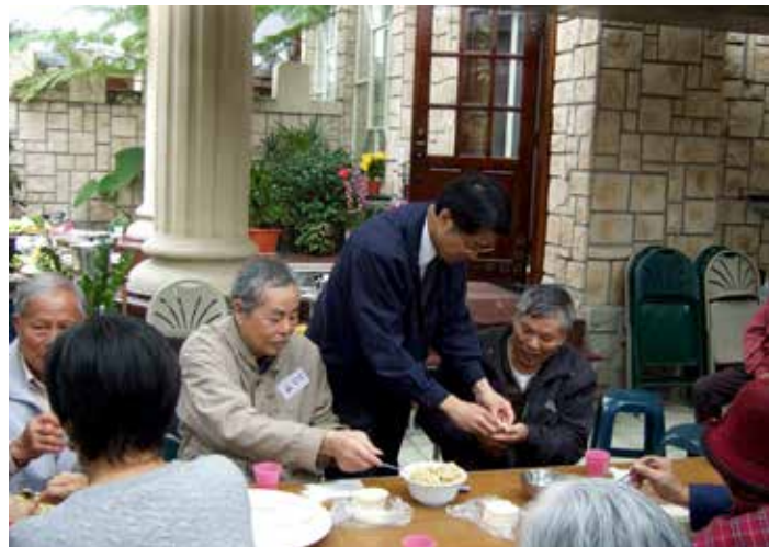
■ 桌面上擺著準備好的餡料和水餃皮，讓病友們自己動手做元寶。