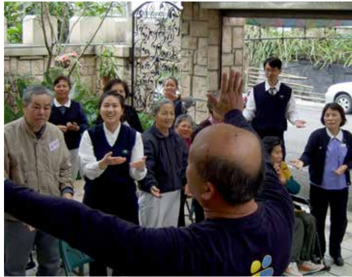
■ 志工邀請復健病友們一同跟著「不老歌」的旋律來活動筋骨。

的同學已經提早抵達會場，志工熱心的帶領他們入座，而參與活動的每一位同學都有特製的姓名名片，方便別在衣服上彼此自我介紹，互相寒暄聊天。而一直有機會在診間與復健病人互動的潘院長，當天也來捧場，看到病友們隨著復