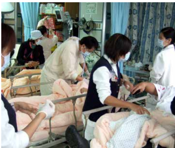
■ 潘院長正用聽診器了解患者肺部的狀況，突然湧進的大量傷患，醫護同仁各司其職緊急做最適當的處置。