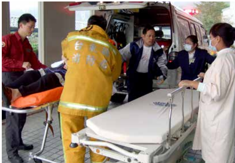
■ 救護車將火警傷患送到醫院時，護理人員已經將病床推到外面等候。

臺東縣鹿野鄉知名的觀光飯店二十一日一早發生火警，消防隊接到消息，陸續將嗆傷及燒燙傷的民眾送到距離最近的關山慈院，急診室立即啓動大量傷患警報，醫護同仁緊急動員，替來院的八位傷患緊急完成初步處置，穩定傷勢後再轉送進行後續治療。