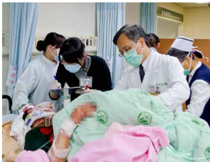
■ 醫護同仁全力治療病人的傷勢，簡院長也抱病前來現場協助救護。

在治療期間，包括林務局嘉義林管處、嘉義縣警察局、消防局、衛生局、觀光局、社會局等單位人員也都陸續派員到醫院關心，尤其嘉義林管處更派人提供一對一的服務，希望能及時回應傷患的