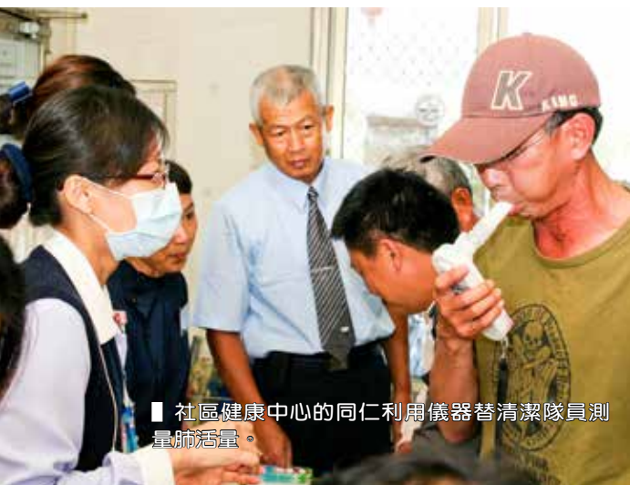
■ 社區健康中心的同仁利用儀器替清潔隊員測量肺活量。