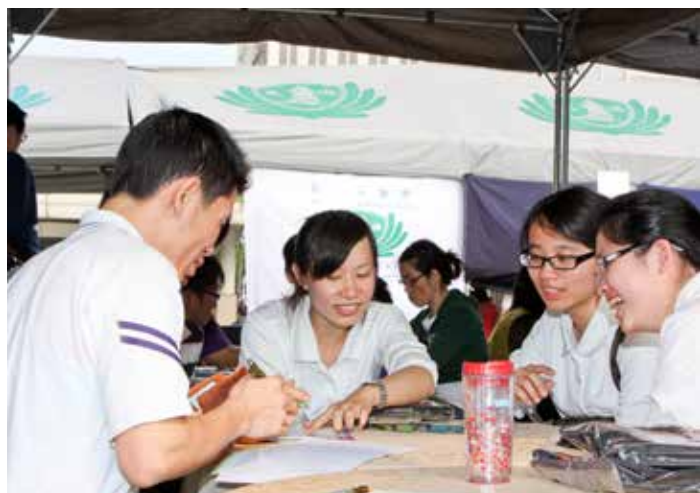
■ 三位財務室同仁協助外勞填寫義診單。