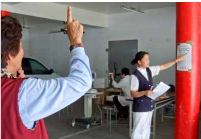
■ 醫護同仁因地制宜，將視力表黏在東安宮柱子上，就可以幫民眾檢查視力。

此外，還有一群來自慈濟技術學院醫務管理系的十多名同學，設計了一連串的伸展健康操、互動式舞蹈衛教及闖關遊戲，內容包括有手部清潔—洗手五時機、預防傳染病—B、C型肝炎、歡樂對對碰圖示、洗手跳舞操，將廟前廣場氣氛炒得很熱烈，更讓等候看診的病患同時獲取了保健知識，還有小禮物可以拿，現場洋溢著喜悅的笑聲。