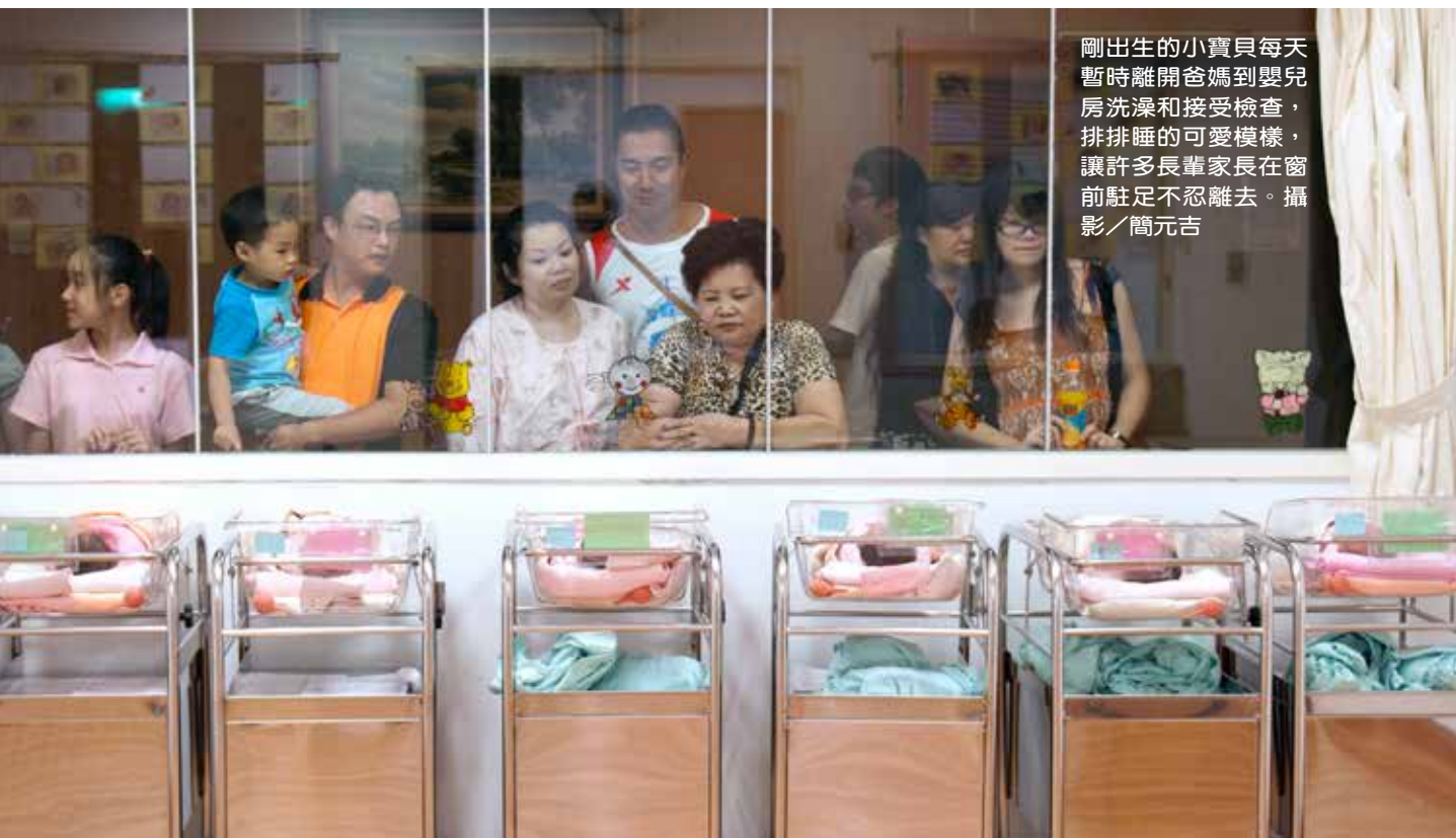
剛出生的小寶貝每天暫時離開爸媽到嬰兒房洗澡和接受檢查，排排睡的可愛模樣，讓許多長輩家長在窗前駐足不忍離去。

也獲得比較害羞的初產婦信任；而親切又專業的男醫師，一樣成為準媽媽們預約的響亮招牌，包括擔任臺北慈院產科部總舵手的李裕祥主任，本身就是婦產界有名的「大腕級」醫師，以及專治不孕症的楊鵬生醫師、笑容可掬又貼心的楊濬光醫師和張銀光醫師，以及資深的洪正修醫師、婦科主任陳國瑚醫師、專長高危險妊娠與高層次超音波的許耀仁醫師等等，每一位專業又親切的醫師，也讓慈濟醫院在各種親子網站上被熱烈討論，成為產婦和媽媽們力推的生產醫院首選。