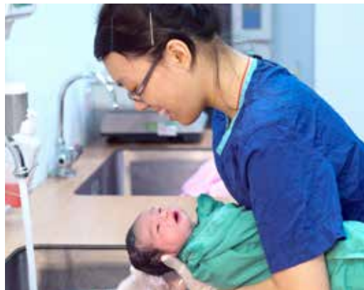
臺北慈院除了有專業的護理人員照顧新生兒，還有醫療志工以媽媽、奶奶心來幫忙，每個小生命都備受呵護。

願來這裡生產。再者，臺北慈院婦產科的醫生每天都以樂觀正向的態度和滿面笑容，為孕婦產婦加油打氣，還有堅強的小兒科團隊及志工媽媽做後盾，讓孕婦自新生命開始孕育至產後母子的照顧，過程都有一股強大的支持力量。