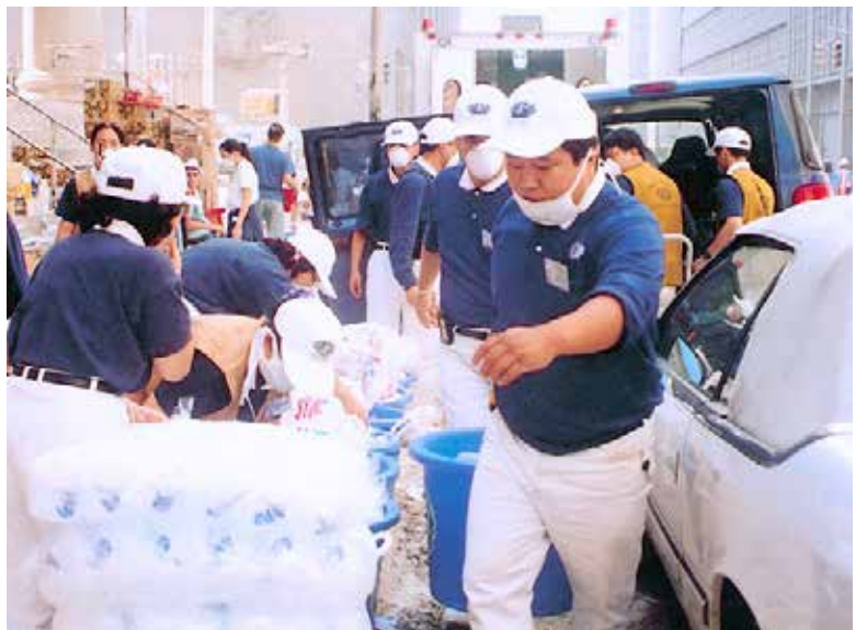
三十位慈濟志工裝運冰水進入九一一災區現場，提供救難人員飲用；慈濟突破萬難走在災難最前的精神，在九一一後感動許多許多醫護人員加入慈濟。