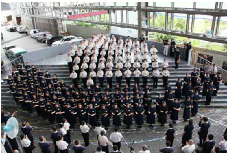
■ 臺北慈院醫護同仁和志工參加《法譬如水》經藏演繹，全部成員同心協力組成一艘莊嚴的法船。

上人曾在二〇〇九年行腳臺北慈院的時候，帶給我們一個祝福：祝福在臺北的我們未來是一棵很大很大的菩提樹。近三年來我們陸續成立了呼吸照顧中心、第二透析中心及身心醫學科大樓，也蒙衛生署通過即將再增加四十九張急性病床。臺北慈院是一株才六年的菩提樹，我們一定會用心血灌溉，不負上人的期盼，讓臺北慈院茁壯成林，以醫學中心之姿在北臺灣成為醫界的清流與人醫典範。