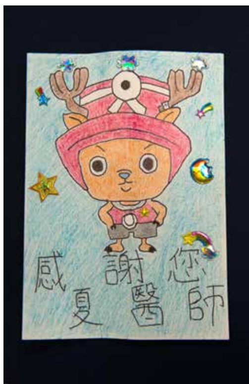
■ 廖小弟弟親手繪製卡片，感恩醫療團隊。