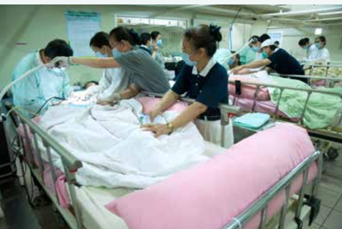
■ 人醫會志工協助醫師安撫並固定病患，以便洗牙工作順利進行。

部嚴重受損，看見小小的身軀插上鼻胃管的氣切，身體飽受皮肉折磨，令人心酸。另一位應是正值青春年華的二十歲女孩，二年前因貪玩交友不慎誤食藥品，卻造成全身痙攣癱瘓迄今，怎不叫人嘆息警惕呢！