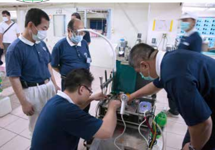
■ 志工提前抵達現場架設及測試義診所需儀器。