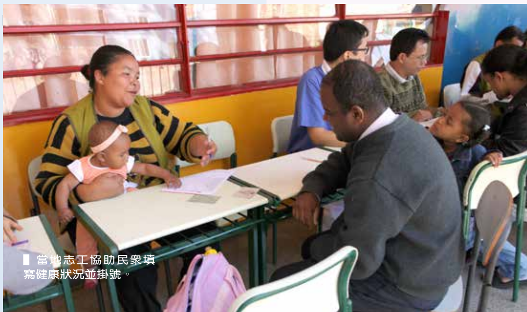
■ 當地志工協助民衆填寫健康狀況並掛號。

每次看完診如果有需要醫藥，當地居民可以到慈濟的藥房教室拿取免費的藥品，有醫師也會自己帶藥物分送給病患。義診進行中會有少數志工前往貧民區發放食物籃，這次因為天氣較冷，所以慈濟也帶來毛毯。