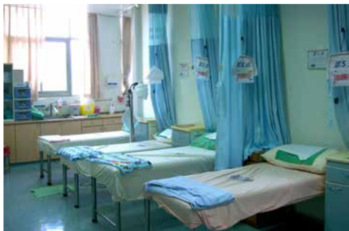
■ 關山慈院婦產科原本的門診空間改置成中醫治療場所，提供民衆接受針灸等治療。