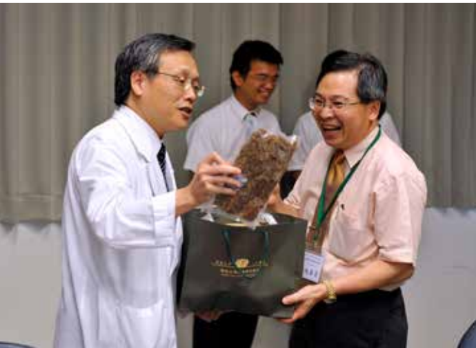
■ 簡院長拿出大愛農場自己生產的健康作物——芒果和蘿蔔乾與委員結緣。

進行各項資料準備，期待慈濟能為國爭光，獲得全球金獎，並希望在嘉義縣衛生局的協助下，將相關經驗分享給雲嘉南地區的醫院。