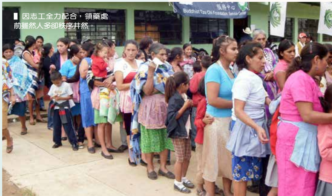
■ 因志工全力配合，領藥處前雖然人多卻秩序井然。

時間在忙碌中匆匆而過，醫護志工都堅持要看完所有的病人才肯用餐，直到下午兩點，看診的醫師們才前往餐室享用當地婦人準備的午餐。義診也到了尾聲，共有超過五百一十二人次的村民受惠，參加的八位慈濟委員與隨喜志工十一人感動地不已，表示雖然不是醫生，但能參與盛會盡己綿薄之力，成就一番善事，同樣感受到助人的喜悅！