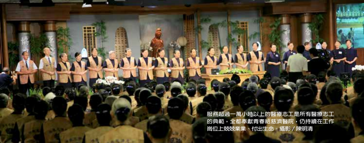
服務超過一萬小時以上的醫療志工是所有醫療志工的典範，全都奉獻青春給慈濟醫院，仍持續在工作崗位上兢兢業業、付出生命。