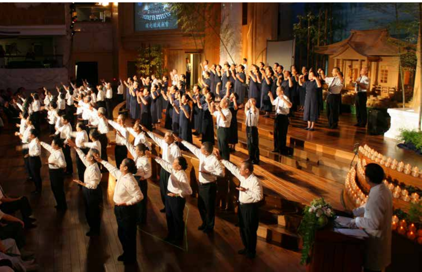
資深醫療志工上臺表演「一性圓明自然」，獻給勞苦功高守護生命的醫院同仁。

慈濟骨科與醫療志業同時發展，至今都是二十五年。陳英和院長在僵直性脊椎炎的治療聞名海內外。來自宜蘭的病