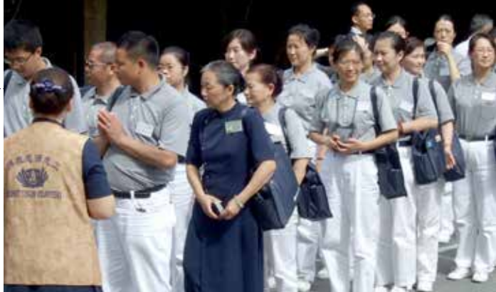
■ 大陸華北與華東見習培訓志工抵達關山慈濟醫院。