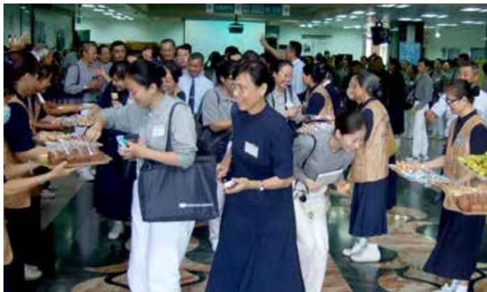
■ 關山慈院雖小，卻有濃濃的人情味。參訪結束，培訓志工享用關山慈院提供的點心和水果。

性告白後，每位來自大陸的慈濟志工都感恩能來這趟尋根之旅。不捨的別離終將到來，學員們和醫院的慈濟志工及各單位主管同仁感恩互道再會，也希望這群新發芽的慈濟種子，能帶著感動回到對岸居住地讓更多的美與善充滿世界各個角落。(文 / 張雅淇)