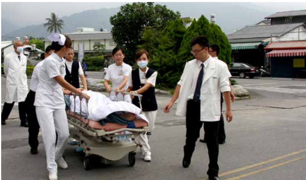
■ 醫護同仁模擬將病人撤離至院外的指揮中心內安置。

張玉麟院長除了肯定參與同仁之努力外，期許每一個人都能將相關防災資訊融入日常生活之中，不但能保障生命安全，更能於災害發生時能冷靜地應變各種突發狀況、臨危不亂的做出最適當的判斷。(文/林可人)📷