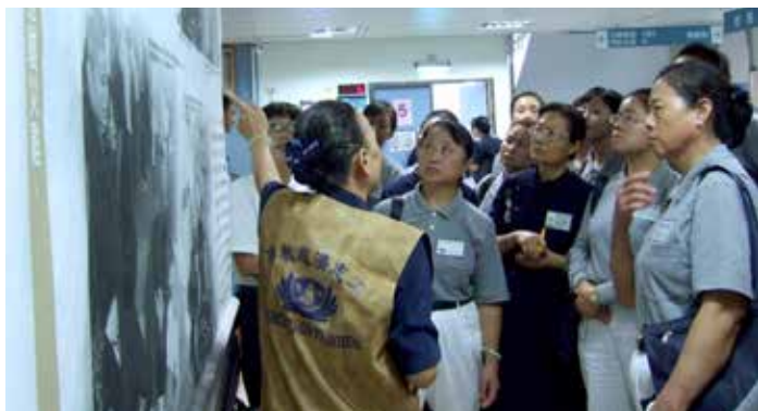
■ 培訓志工認真的聽著醫院志工解說關於證嚴上人創立慈濟醫療志業的因緣及歷史。