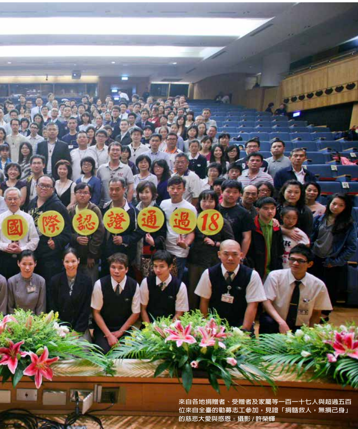
來自各地捐贈者、受贈者及家屬等一百一十七人與超過五百位來自全臺的勸募志工參加，見證「捐髓救人，無損己身」的慈悲大愛與感恩。