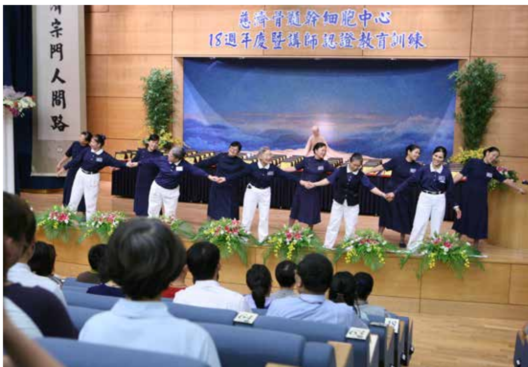
慈濟志工手牽手上臺表演「因為你因為我」，讓在茫茫人海中相遇的捐髓者與受髓者的心緊緊連在一起。

有的捐贈者及長期默默付出的捐贈關懷小組志工致敬。全場有來自各地捐贈者、受贈者及家屬一百一十七人與超過五百位來自全臺各地的勸募志工，總共七百多人齊聚一堂；並由林執行長代表頒贈紀念牌給與會的八十五位年度捐贈者，見證「捐髓救人，無損己身」的清水之愛。