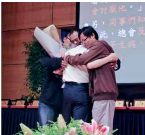
尋求非親屬配對的小東，幸運的遇到了宋先生，小東的家人與宋先生感動相擁。

「謝謝你讓我擁有了第二次的生命，要不是你，現在的我可能也不會站在這裡。」來自彰化的受贈者小東（化名）