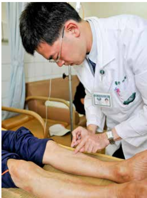
大林慈院腫瘤中心邀請中醫科醫師共同會診，提供食療、針灸和穴道按摩等醫療服務，提升癌症治療品質。

痛，一面疲於奔命投醫。現在除了藥物進步之外，還配合了內科、外科、放射腫瘤科及其他科別的醫師，一起為病患擬定一套治療方向與計劃，接下來在整合式治療的門診再做計劃的執行。