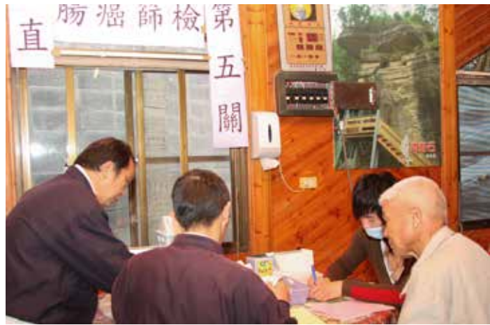
雲林縣衛生局與大林慈院合作舉辦癌症篩檢活動，深入古坑鄉草嶺村為當地鄉親進行篩檢。

二〇一一年三月起，配合政府政策新增大腸癌糞便潛血篩檢，凡是五十至六十九歲的民眾，每兩年可接受一次免費糞便潛血檢查。新的檢查方式採用免