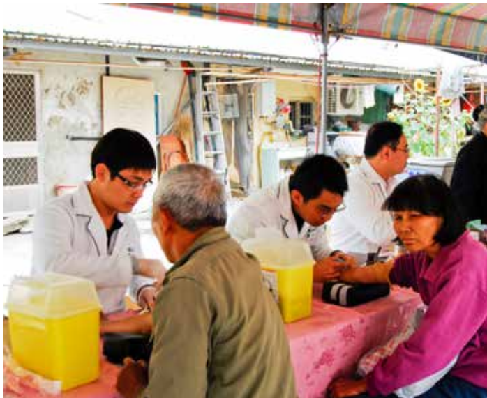
除了在醫院推動癌症篩檢之外，大林慈院更深入鄰近的鄉鎮社區進行推廣。圖為醫護人員在嘉義縣大埔鄉進行複合式篩檢。

在推動篩檢的過程中，除了個案管理師負責篩檢後的陽性反應個案管理與追蹤外，還包括發現陽性個案時，個案管理師主動聯繫個案回院確診，以及進一步的篩檢和切片檢查，確定罹患癌症即轉至腫瘤中心；若無罹癌者，管理師以諮詢與衛教方式教導民眾平時的保養。同時透過「個案管理系統」作個案登錄、掌握並追蹤病人的情況，給予病人最及時且無微不至的協助。醫師也可以透過這套系統獲得各種治療統計數字，作為治療與研究的資訊。兼任腫瘤中心主任的蘇裕傑指出，不只是藉由癌症篩檢，從醫療品質監控指標的執行中，能