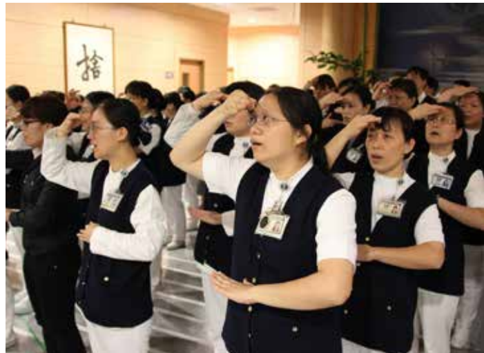
護理部的白衣天使結束繁忙的工作，下班後仍繼續投入水懺排演，認真的希望讓自己的心更柔軟，嘉惠自己也嘉惠病人。

因為前三次驗收，醫療團隊都沒有通過，因此大家抱著壯志必成的決心，希望這次的集訓能獲得肯定。