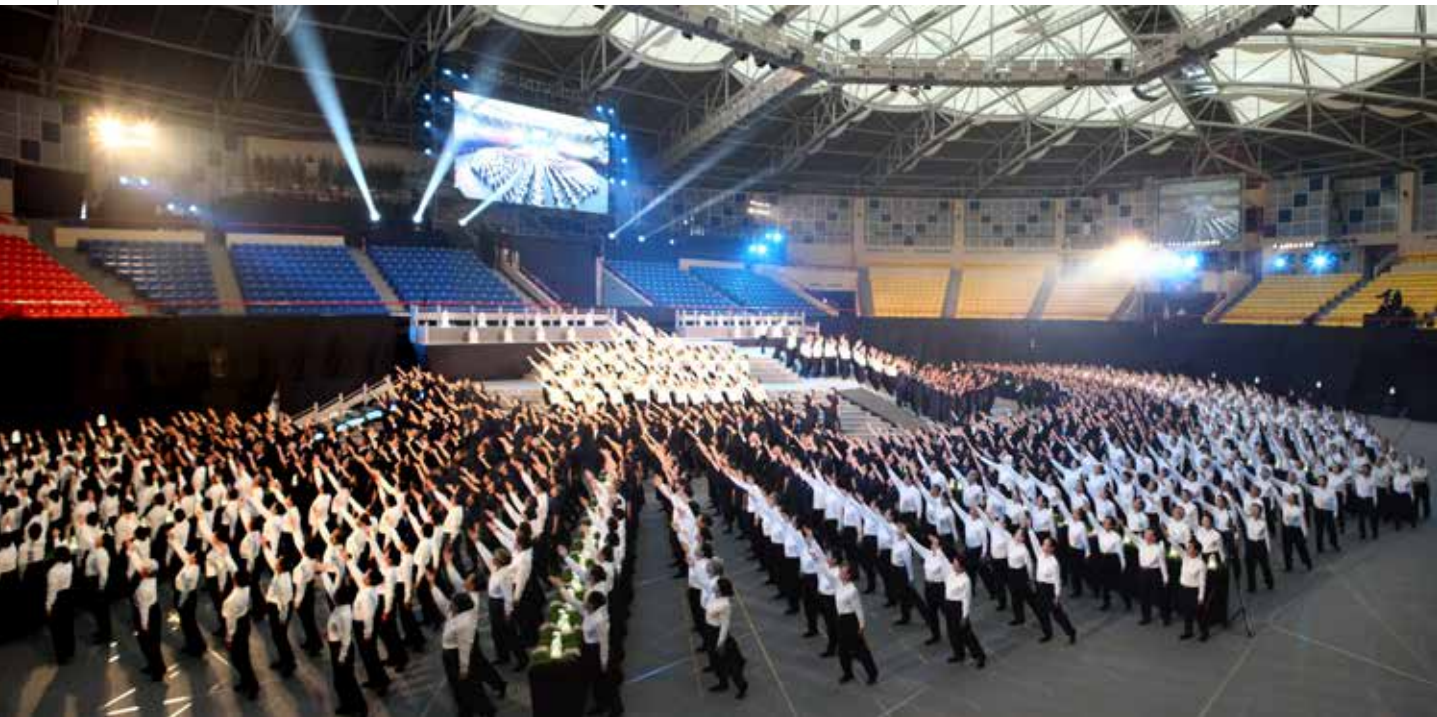
三月九日下午，證嚴上人親臨花蓮小巨蛋觀賞水懺演繹，共一千零八十位入經藏的菩薩至誠演出，道氣撼動全場，場外陽光燦爛，場內感動久久不息。