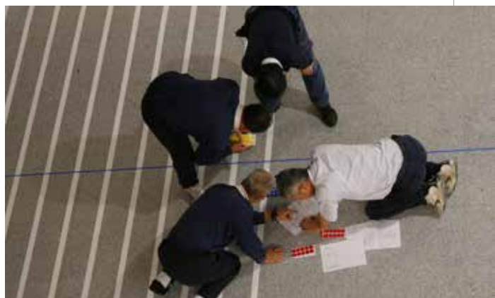
儘管是練習的臨時場地，負責地標作業的志工仍不厭其煩的貼出複雜又正確的地標。