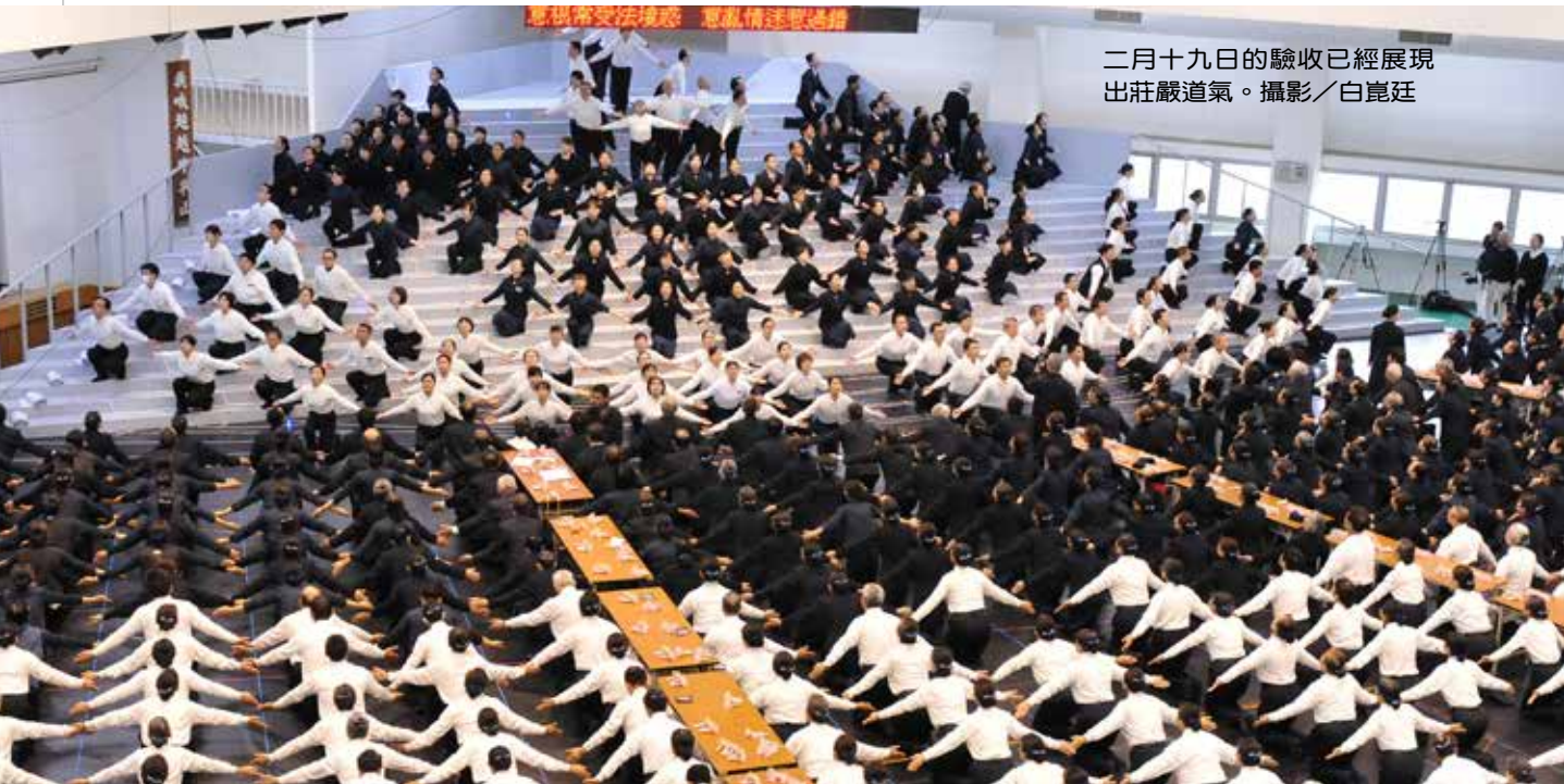
二月十九日的驗收已經展現出莊嚴道氣。

二月十五日傍晚，花蓮、玉里、關山慈院同仁與社區菩薩再度會合在慈大人文社會學院體育館的模擬舞臺進行彩排。樂聲揚起，經藏菩薩大聲唱誦經文，跟上節拍，循著地標，一步一步緩緩前進，前後對正，左右標齊，隊伍從