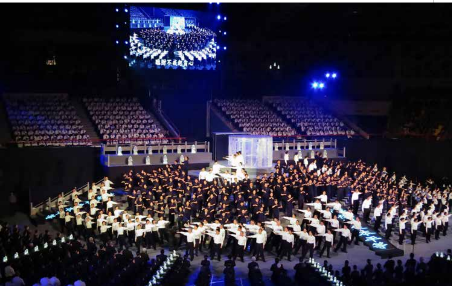
慈濟醫療志業所演繹的〈懺悔業障之一一懺悔〉，以水滴的形狀代表法水滌淨心垢。

中、慈濟小學師生演繹，每場次僅三千多個座位，一票難求，因此大會決定於八日「最後」一次彩排之日即當成正式演出，邀請當地媒體朋友拍照攝影，也開放給同仁與民眾觀賞。