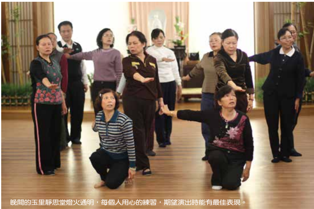
晚間的玉里靜思堂燈火通明，每個人用心的練習，期望演出時能有最佳表現。

經過兩個月的密集訓練後，大家都有一個共同的想法，就是一天二十四小時真的不夠用，於是每個人都有自己的秘密練功時間，例如：骨科林