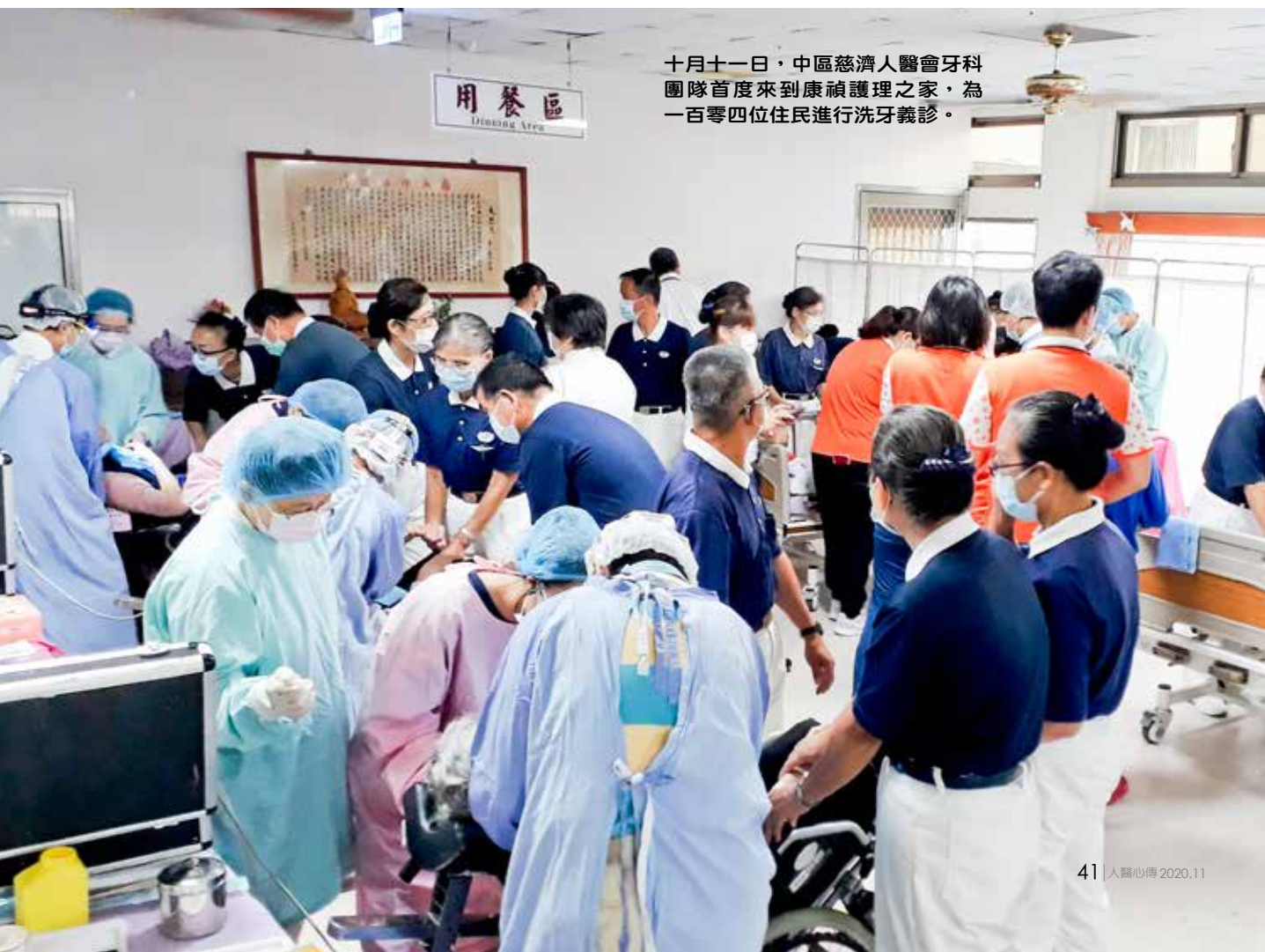
十月十一日，中區慈濟人醫會牙科團隊首度來到康禎護理之家，為一百零四位住民進行洗牙義診。