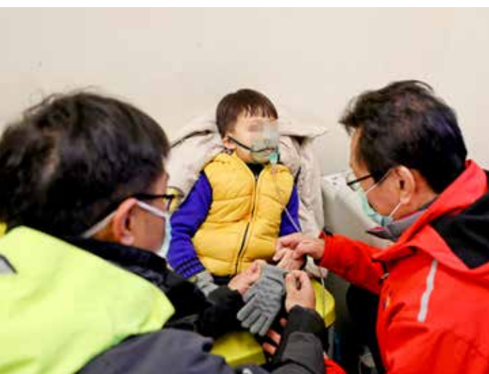
男童嘔吐不止，屬於明顯的中度高山症狀，醫護人員趕緊使用氧氣治療。