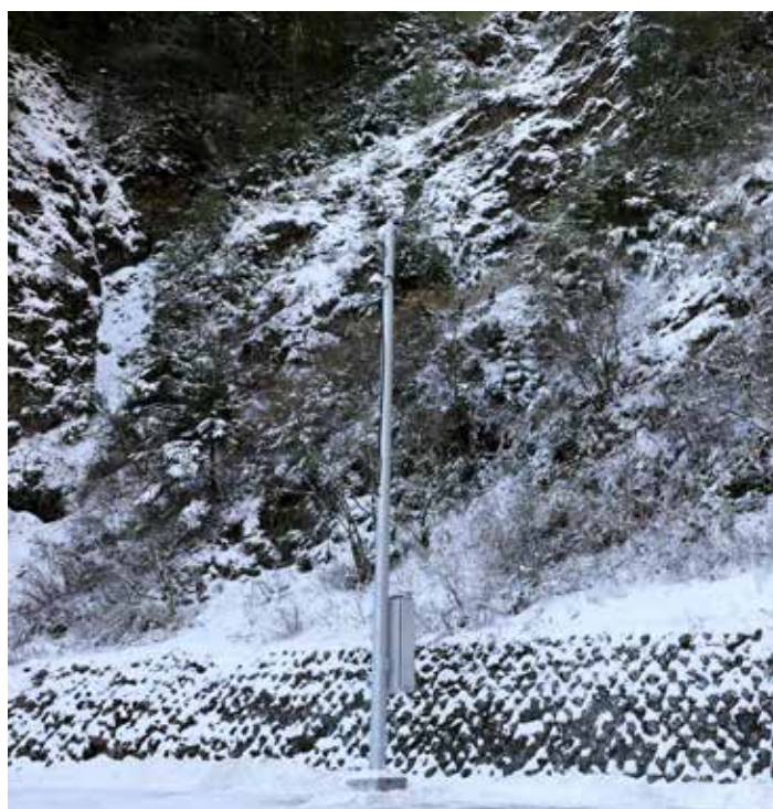
醫療隊碰上今年入冬以來第三波寒流，合歡山上的溫度幾近攝氏零度，路旁皆是冰雪堆積。

雪季醫療於今年邁入第十七個年頭，在這十七個寒冬裡，始終有人不畏風雪，在三千米的高山上守護民眾的生命健康，對於喜歡在冬天遊合歡山的民眾而言，最想對這群服務奉獻的醫護人員說一聲：「有你們真好！」（文、攝影／鍾懷誼）