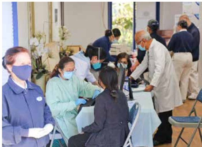
三月十八、十九日，美國愛滿地慈濟醫療中心舉行疫苗施打活動。美國慈濟人醫會醫師團隊全程關注流程與安全。

情期間，政府接種疫苗的速度仍然不夠快。要解決疫情我們認為主要的有兩個方法，一是我們正在做的茹素、推素，另一件事就是打疫苗；政府既然有針劑，我們就趕快申請來幫居民打。」