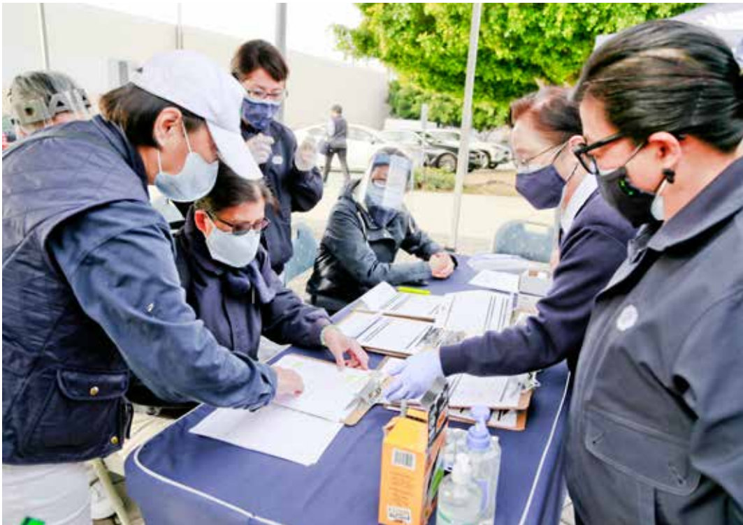
慈濟志工踴躍參與、分工合作，準備好讓民眾填寫的基本資料表單。

預約的現場看診，不會造成病人與來打疫苗民眾交流群聚的情況，還有愛滿地診所的室內外空間都比較寬敞，這也是考量到社交距離問題。」