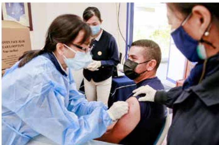
美國人醫志工齊心為民眾服務。

時注重防疫模式，需選擇在有充足社交空間的場所進行。例如之前在阿罕布拉醫療中心施打疫苗，不在診所內打，而是在戶外進行，並嚴格控制現場人潮及流量。本次改至愛滿地醫療中心舉辦注射活動，是因為該診所還沒有開放大規模看診，只提供電話問診的服務及電話