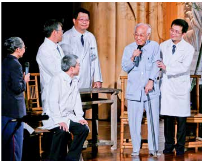
花蓮慈濟醫院二十五周年慶，楊教授上臺見證慈濟醫療傳承已開枝散葉。