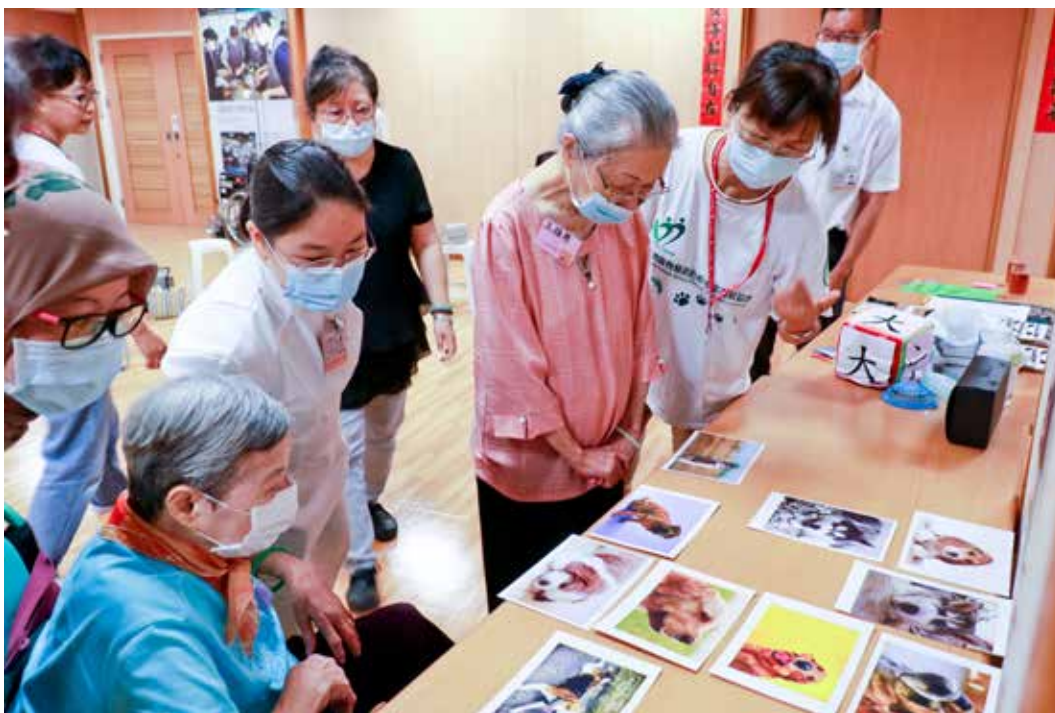
神經內科「樂智同學會」規畫各種有趣課程，有時連狗狗也擔任主角。

彼此加油打氣，中醫氣功加上節慶時設計的復能活動十分密集，地點就在護理站前，既方便照看病人又極具可近性。