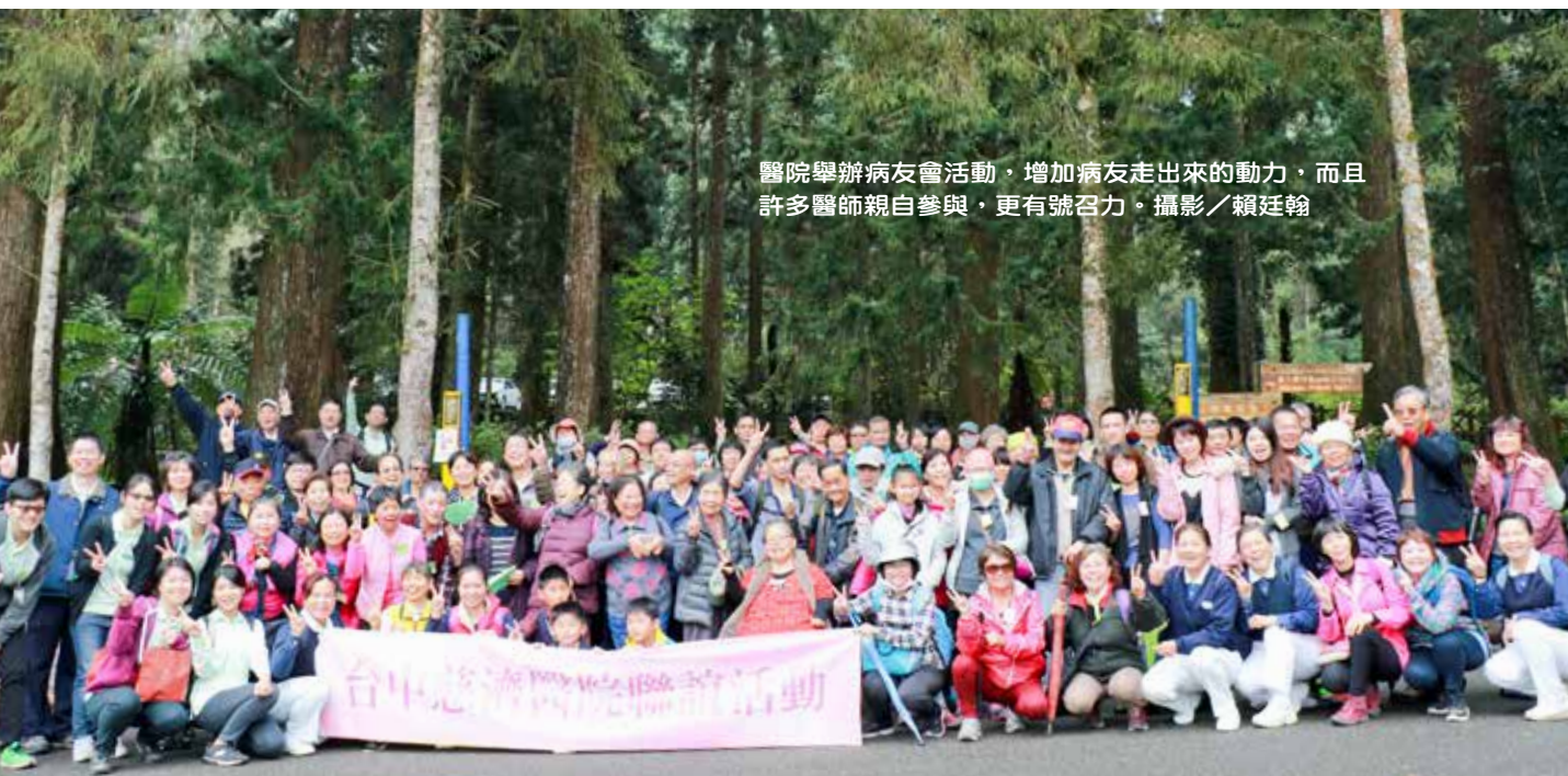
醫院舉辦病友會活動，增加病友走出來的動力，而且許多醫師親自參與，更有號召力。