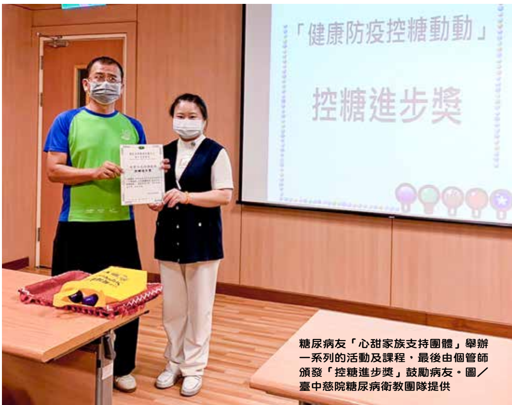
糖尿病友「心甜家族支持團體」舉辦一系列的活動及課程，最後由個管師頒發「控糖進步獎」鼓勵病友。

病友間的情感不僅具備「我們是同一國」的同病相憐，他們的就醫經驗、康復過程、生活點滴也會有一定程度的同質性，若彼此能把跨越困難經驗的資源或訊息共享，甚至給對方實質幫忙與協助，例如：互相提醒回診就醫、結伴共