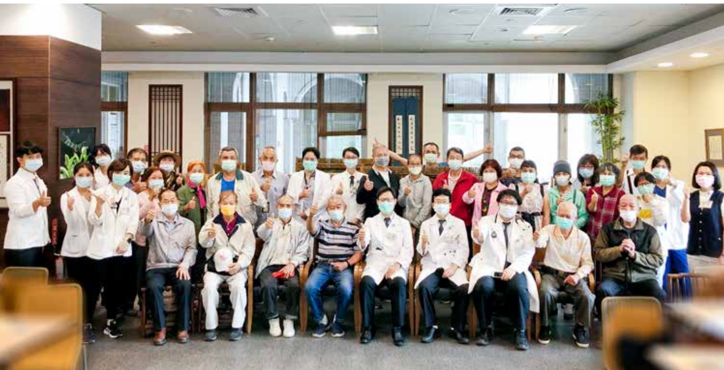
二〇二〇年胸腔內科「神采『肺』揚・自在呼吸肺阻塞病友會」，主治醫師全員到齊。