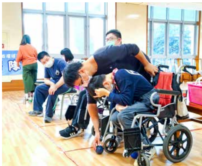
二〇一六年復健科為年輕腦麻病友組成「地板滾球隊」，希望透過特別的運動讓病友舒展筋骨、增進體能。

病友會絕不僅僅是一群人搭遊覽車踏青這麼表面，背後要考慮的細節多如牛毛。不同疾病別有個別特質的考量，包括：地點、車程、食物與課程設計的運作模式全都要考慮。例如：人工電子耳稚齡小朋友特別多，常選擇去觀光工廠，讓孩子手作後帶成品回去；頭頸部癌友得思考管灌病人食物需求；神經外科脊椎損傷病友得刪除交通車程久、路況崎嶇的地點。