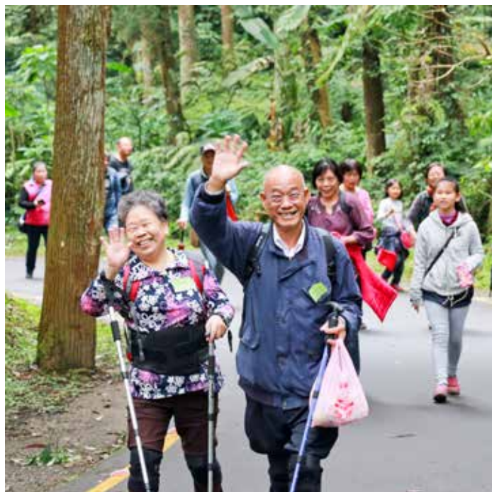
病友與家屬的笑容，讓醫療團隊舉辦病友會的疲累頓時消失，再麻煩也值得。

「復健失能病友會」主要對象是入住「腦中風病人急性後期整合照護病房」的病人，病友把握三個月復健黃金期，