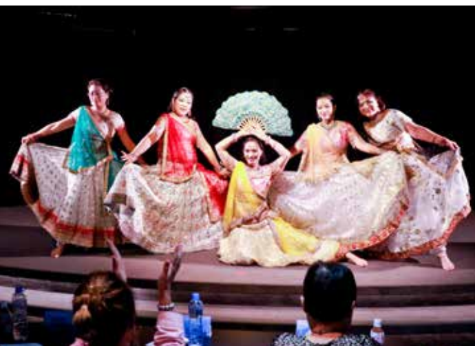
二〇二〇年十月臺灣癌症基金會舉辦「2020第11屆粉紅運動——愛波舞后夢遊仙境」舞蹈比賽，臺中慈濟醫院乳癌病友組成的「慈妹印度寶萊塢」舞團榮獲「魅力滿點獎」與「金有創意獎」。

一次練舞場地。病友阿玉因切除腋下淋巴影響手臂連插腰都做不到，加入舞團排練，不知不覺插腰、掛衣服都沒有問題，甚至能自己梳頭，愈來愈快樂。華麗出場的公益表演總是讓人眼睛為之一亮，甚至還報名全臺灣「愛波舞后」競賽獲獎。