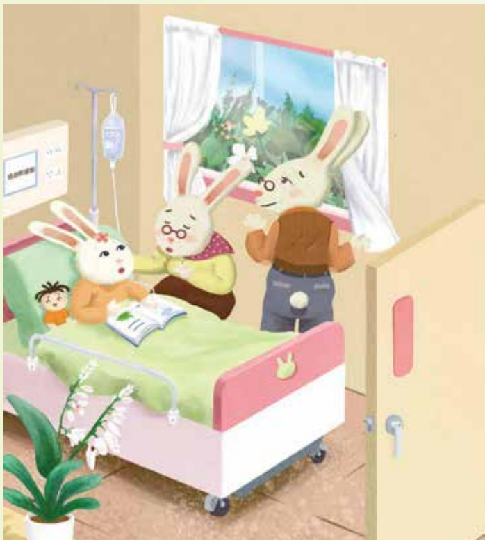
透過兔小妹的故事闡述何謂造血幹細胞，傳說中的骨髓移植並不可怕，還能拯救血液疾病患者給予重生的機會。