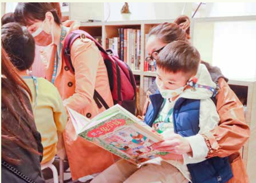
小朋友翻閱著兒童繪本，在媽媽的導讀下知道兔小妹生病了，認識什麼是血癌，為什麼造血幹細胞捐贈可以救人。