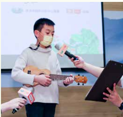
新書發表會上，小初特別透過彈奏烏克麗麗，唱出感謝的歌曲，感謝媽媽的救命恩人。

去構思，所以以動物兔子當主角，能更貼近的讓孩子融入故事裡，孩子的接受度也會比較高。