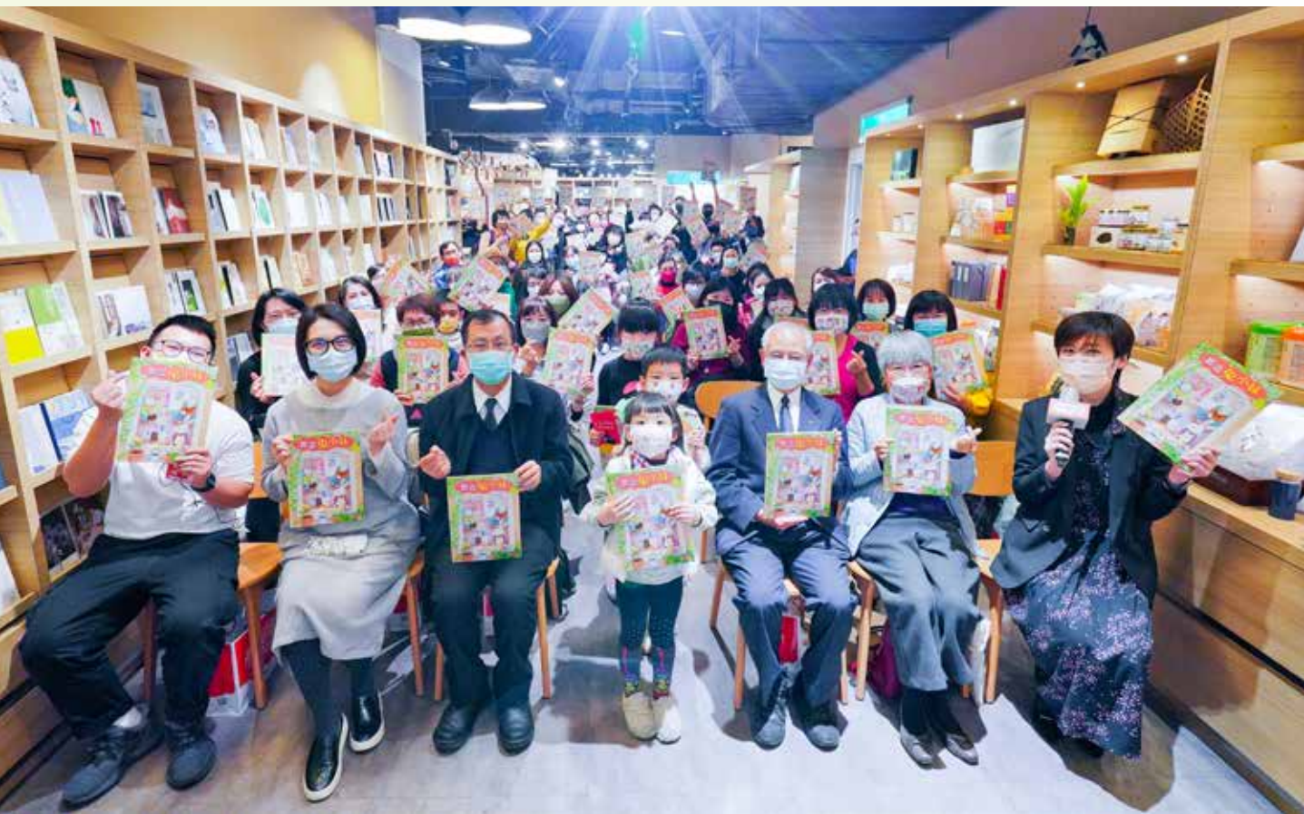
《想念兔小妹》繪本，二〇二二年一月九日在臺北靜思書軒信義誠品店舉辦新書發表會。

「您的捐贈、他的重生！」一語道盡骨髓捐、受贈者之間的「髓」緣關係，也在慈濟推廣多年的「骨髓捐贈」歷程中，不斷思考唯有傳遞正確的捐贈觀念，才能使整體捐贈過程更圓滿順利，因而催生出《想念兔小妹》教育繪本，這是一個傳達藉由造血幹細胞捐贈移植，讓愛延續的故事，期待以活潑豐富的繪本內容，與親子孩童分享，種下善種子、啟發善效應。