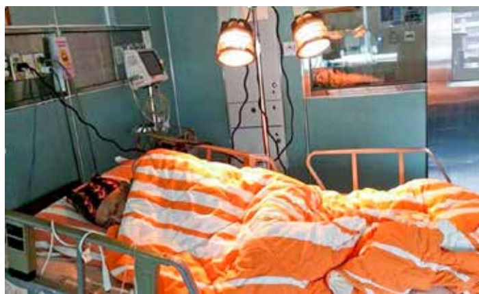
治療血癌，等待有緣人出現，才能進行造血幹細胞移植，才有活命的機會。