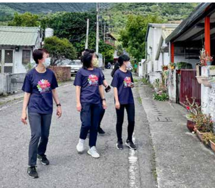
花蓮慈院社工團隊除了在定點義診上陪伴看診鄉親外，也主動走進社區詢問有無鄉親需要醫療服務。