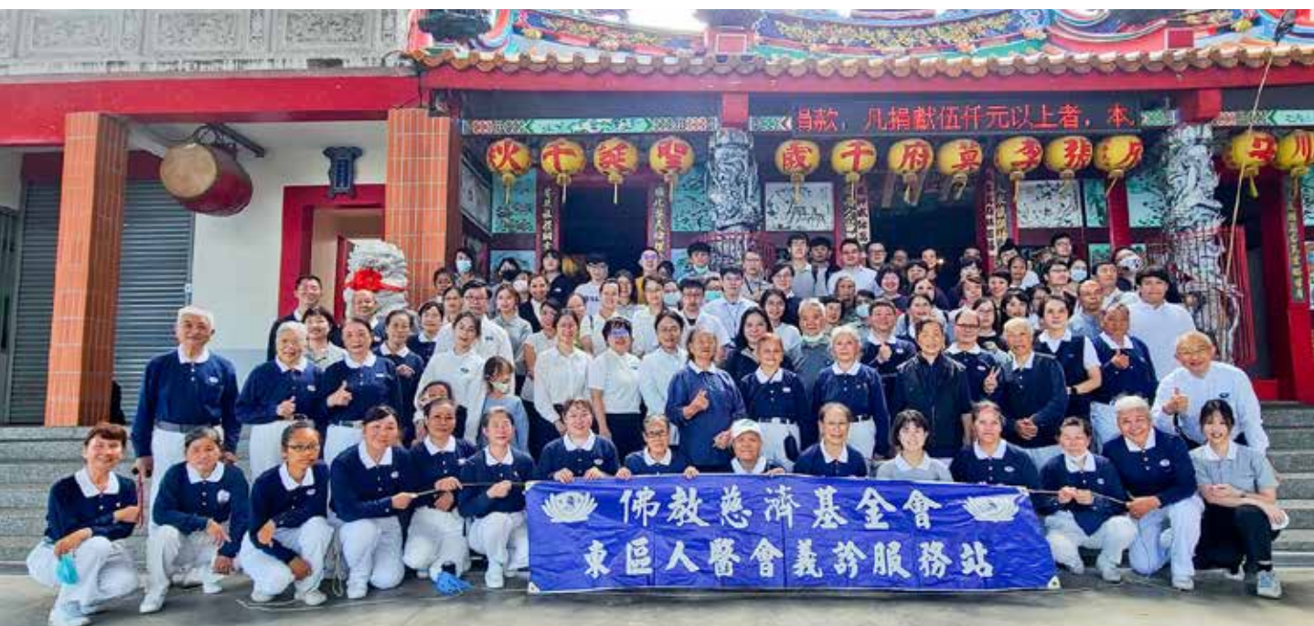
因疫情睽違兩年的太麻里義診重新啟動，活動圓滿，東區慈濟人醫會相約後會有期。