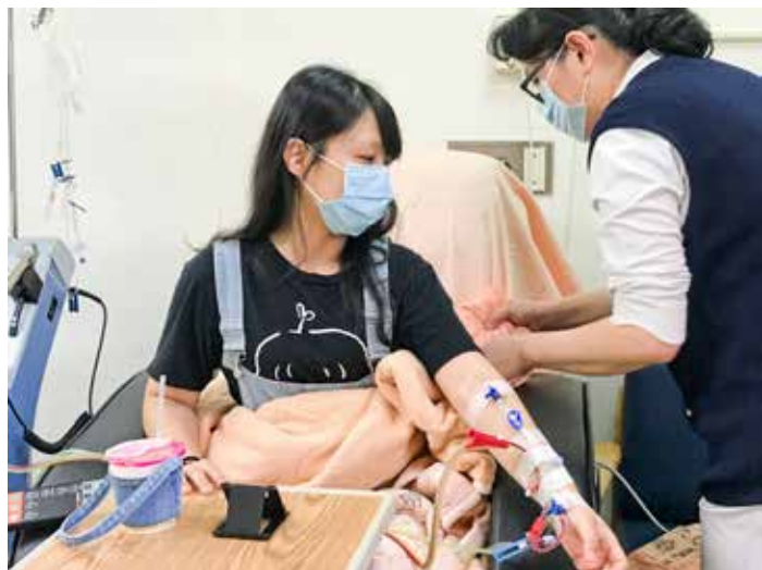
二〇二二年再次走進花蓮慈濟醫院的造血幹細胞收集室，再次捐贈救人一命。