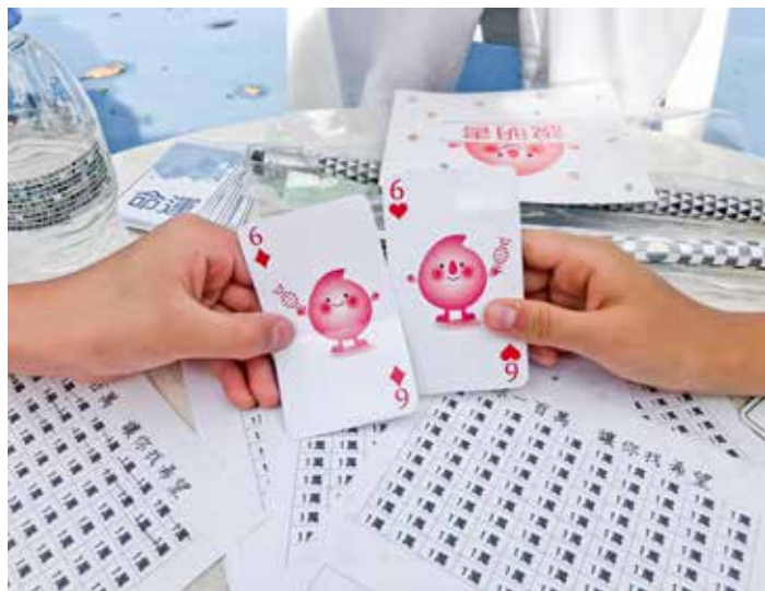
在一場《給你一百萬讓你找希望》的桌遊活動中，找出第六對相遇的捐贈者：從撲克牌中一次抽出兩張，兩張同時出現六，即表示配對成功。