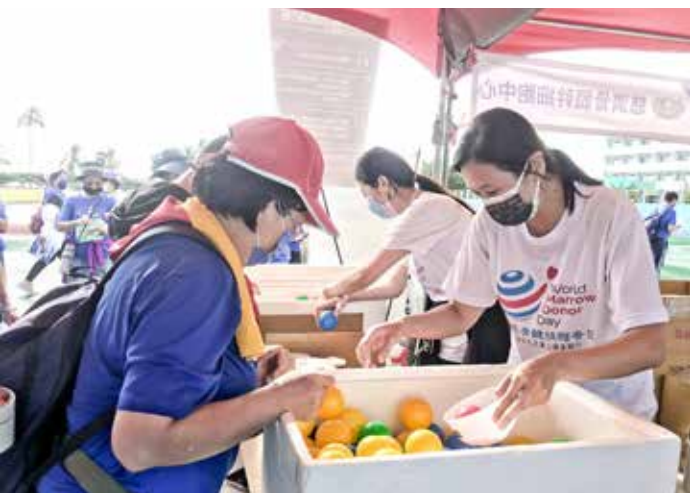
從球堆裡找出與你基因代碼相同的球，代表 HLA 血樣複檢結果，這遊戲吸引大小朋友踴躍參加。