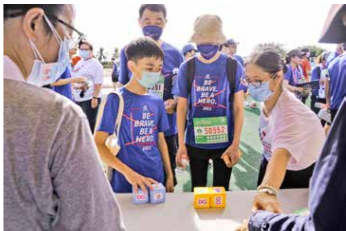
藉由骰子遊戲，讓民眾體驗人類白血球組織抗原分型 (A,B,C,DQ,DR) 配對的機率，相當不容易，資料庫裡愈多有效建檔，即可提升病人配對成功的機率。