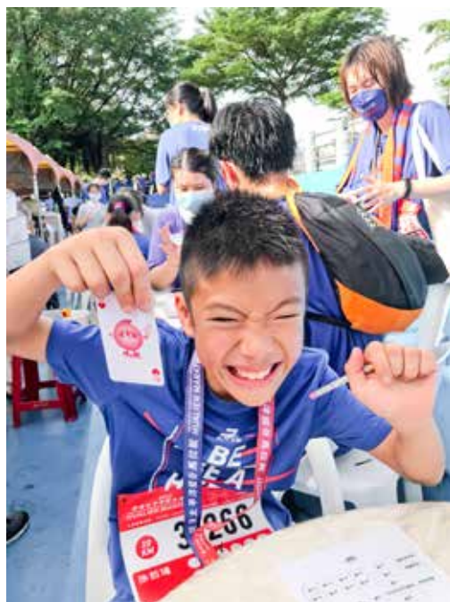
「耶！我配對到了！這樣就有救了對不對！」挑戰桌遊，成功配對上時，忍不住洋洋得意起來現場歡呼。

二〇二二年花蓮太平洋縱谷馬拉松路跑活動，共計有超過六千六百多名選手齊聚一堂，一起跑出活力、跑出健康。慈濟骨髓幹細胞中心也在美崙田徑場設攤，結合花蓮社區志工與慈濟大學學生一起出任務，邀請路跑完的選手們，進行一場基因配對遊戲，體會搶救生命的難能可貴。