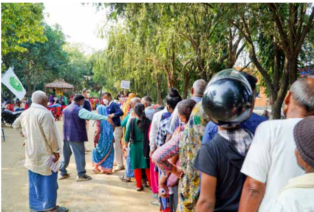
三日義診期間，每日排隊求診的人潮多如川流不止。