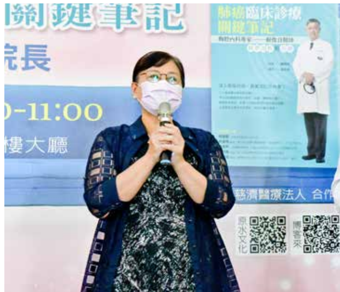
病友鄭女士分享健康檢查的重要，才有機會早期發現病灶，盡早治療。