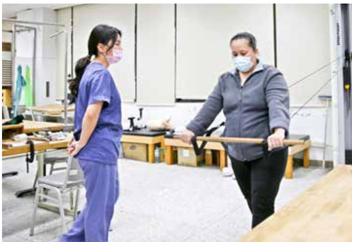
胡小姐透過花蓮慈院職業醫學科、復健部等跨團隊治療，除職能復健計畫，另有工作強化訓練，包含更換枕頭套、搬運箱子等動作，提升工作所需能力。