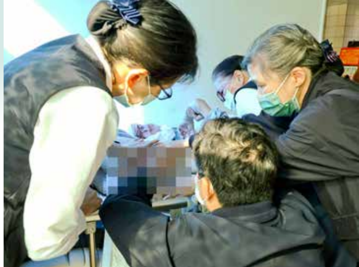
醫護團隊同心協力為褥瘡病人清創。

禍，雙腳不良於行，又因未積極復健，如今腳部肌肉萎縮、腹部大、血壓高。曾醫師診察其膝蓋關節，研判骨頭應已恢復，鼓勵她要多出去練習走路。「妳才三十六歲，又有四個小孩要照顧，所以要努力復健，做孩子的依靠；常常練習走路，愈走就愈健康。」